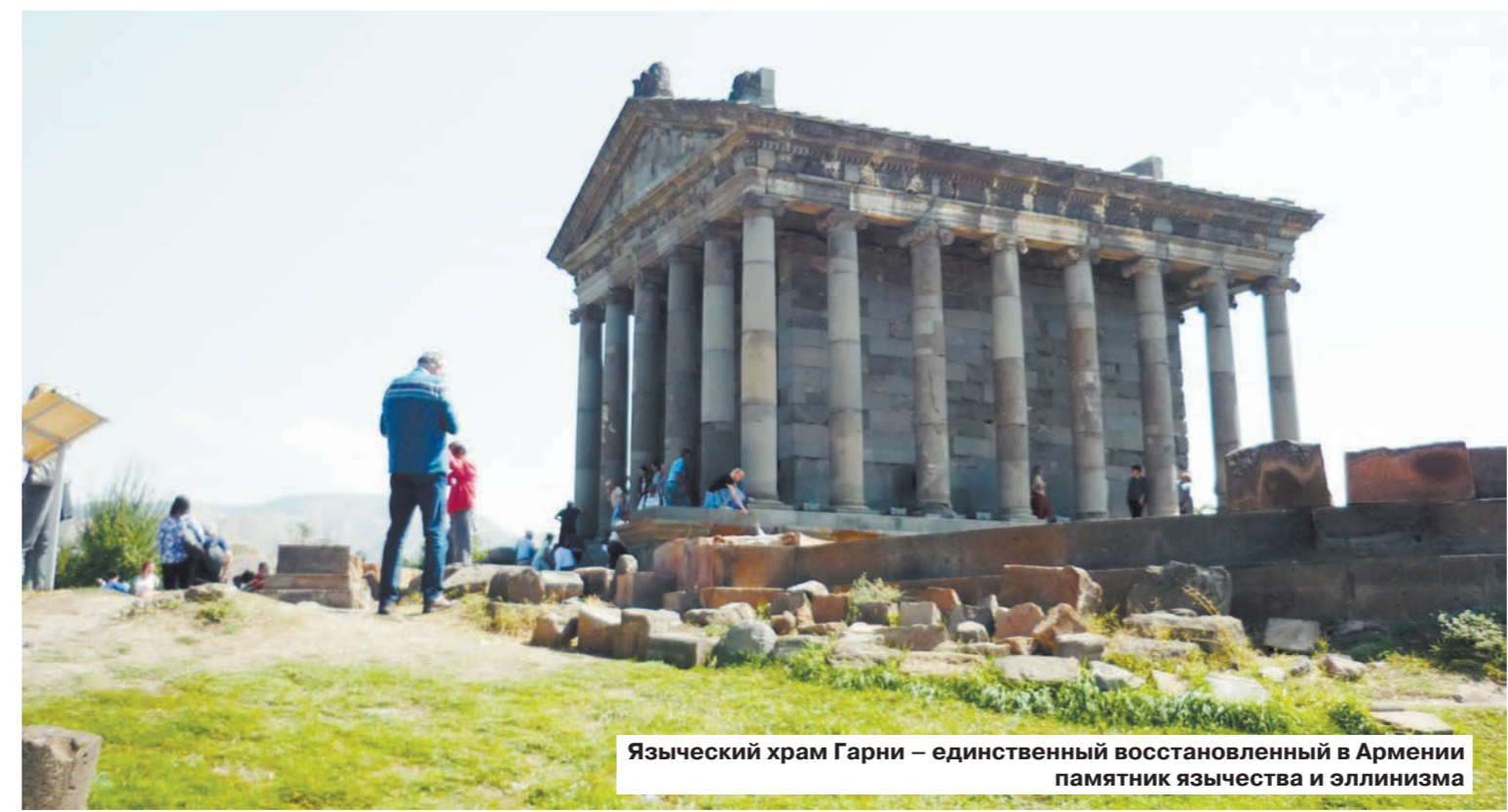
Языческий храм Гарни – единственный восстановленный в Армении памятник язычества и эллинизма