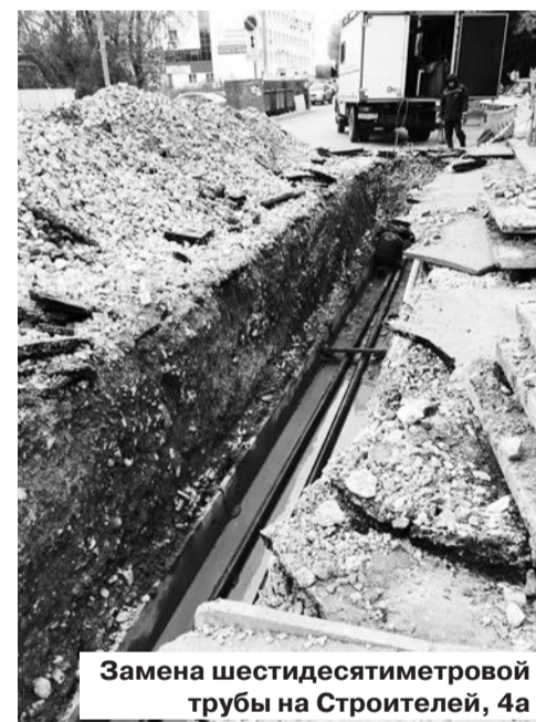
Замена шестидесятиметровой трубы на Строителей, 4а

В выходные МКУ «Благоустройство и ЖКХ» совместно с «Водоканалом» вышли на устранение аварии на тепломагистрали в сторону Строителей, 4а. К вечеру воскресенья работы были завершены, было заменено 60 метров трубы. Были проблемы в двух детских садах: детский сад №39 с сегодняшнего дня работает, завтра откроется садик на Циолковского.