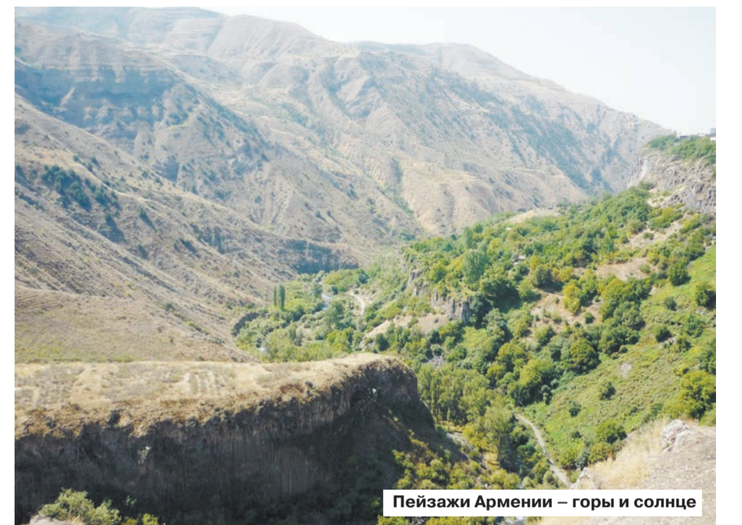
Пейзажи Армении – горы и солнце