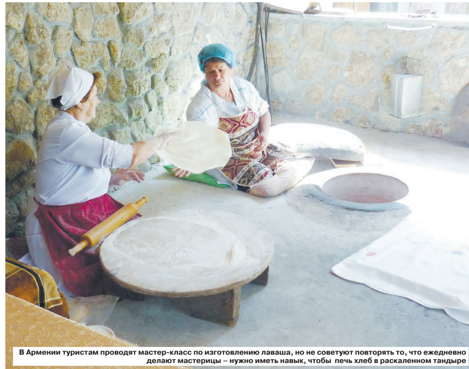
В Армении туристам проводят мастер-класс по изготовлению лаваша, но не советуют повторять то, что ежедневно делают мастерицы – нужно иметь навыки, чтобы печь хлеб в раскаленном тандыре

– Для приготовления коньяка используются местные сорта винограда. Всего используется более 10 сортов, произрастающих в Араратской долине. Это Воскеат, Гарандамк, Чилар, Мсхали, Кангун и Бананц, Кажет, Мехали. После сбора виноград отправляют на отжим, затем он проходит так называемую винификацию. Полученное в процессе молодое вино уже считается виноматериалом, который отправляют на ди-