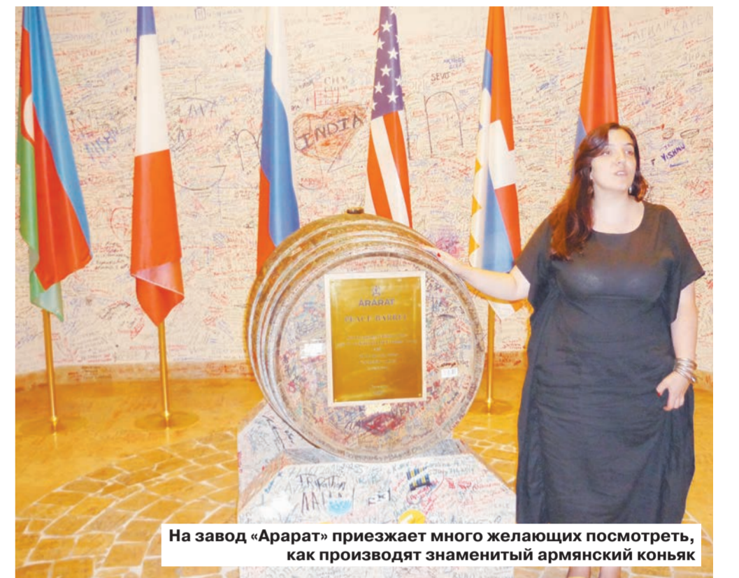
На завод «Арарат» приезжает много желающих посмотреть, как производят знаменитый армянский коньяк