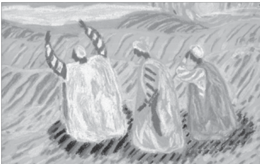
«Мавритания. Молитва». Автор Ксения Зубова

Мавритания – суровая страна, полностью лежащая в пустыне, с гордыми и непреклонными жителями. Один мавр пригласил нас в гости на дачу, расположенную среди песков. И мы катались с золотистых