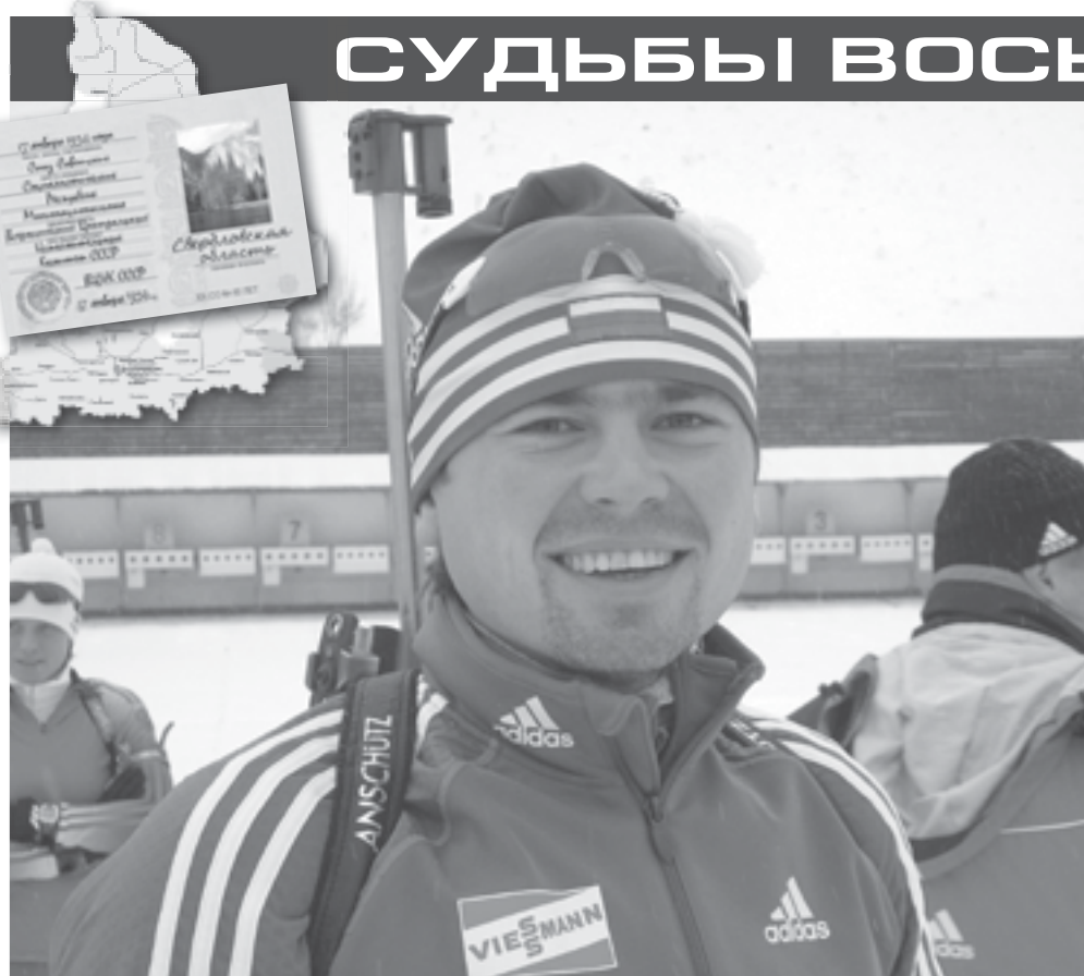
Во время тренировок в составе сборной России по биатлону в Австрии в 2009 году.

■ Благодарим за предоставленные материалы редакцию газеты «Тевиком» (пос. Рефтинский)