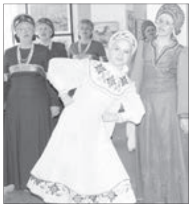
Юбиляров поздравляет хореографический ансамбль «Апельсин»

«Это было удивительное время в моей судьбе, – улыбает-