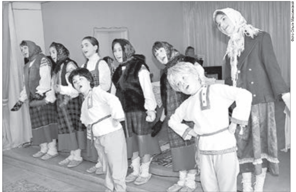
В сказке-опере «Змейкино подаренье» участвовали десять юных актёров