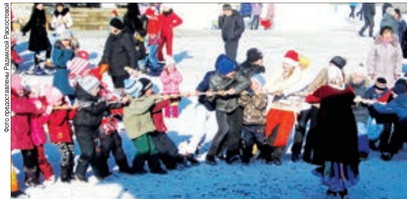
Масленичные гуляния в Полдневой

Минувшие выходные можно по праву назвать самыми весёлым и вкусными. Масленичные гуляния прошли повсеместно. Так в селе Полдневая можно было отведать блинов, которыми щедро угощали члены Совета ветеранов села, и выпить чая из дымящихся самоваров, а также принять участие в традиционных русских народных играх и забавах и прокатиться в санях. Гости с большим энтузиазмом перетягивали канат, соревновались в беге в мешках, одни защищали, другие штурмовали снежную гору, мужчины мерились силой и ловкостью в бое на мешках. В самый разгар веселья пришла Масленица, чучело которой вскоре было сожжено под масленичные песни и хоры.