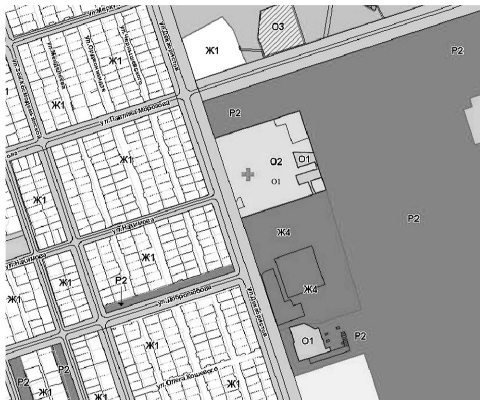
— земельный участок с кадастровым номером 66:59:0101019:5488

Приложение № 1 к постановлению Главы Полевского городского округа от 14.09.2015 № 1672