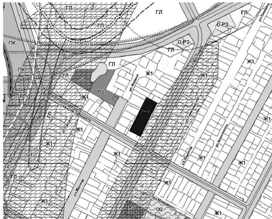
— земельный участок, расположенный за домом № 178 по улице Жилина