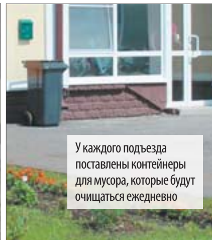
У каждого подъезда поставлены контейнеры для мусора, которые будут очищаться ежедневно

Бригада из 10 человек ежедневно трудилась, чтобы на территории навести красоту и порядок. Высаживать цветы помогли отряды мэра