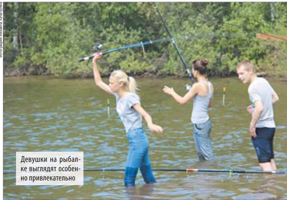
Девушки на рыбалке выглядят особенно привлекательно

Впрочем, основное в таких оживлённых конкурсах – это не результат, а настроение. Без него на подобном празднике никак. У взрослых оно было «клёвым» от рыбалки и окружающей природы, а