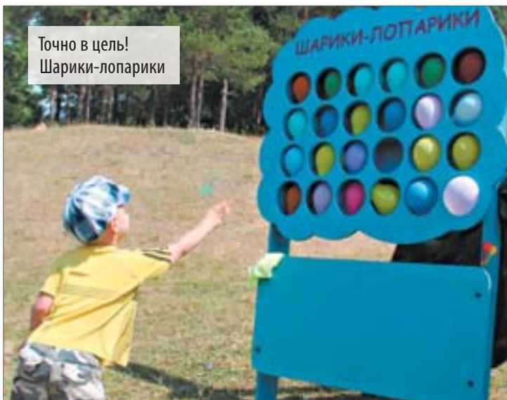
Точно в цель! Шарики-лопарики

детям активно помогали веселиться представители «Надёжи» и артисты студии «Арт-Этюд». Конкурсы, хороводы, призы – в детском возрасте не так много надо для счастья, зато это немного остается с ребёнком на всю жизнь.