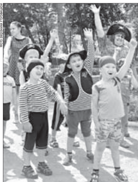
Дошколята на день превратились в морских пиратов