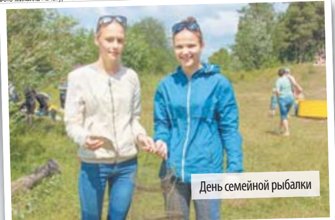
День семейной рыбалки

Стоимость подписки с августа 2016 года (на 5 месяцев)