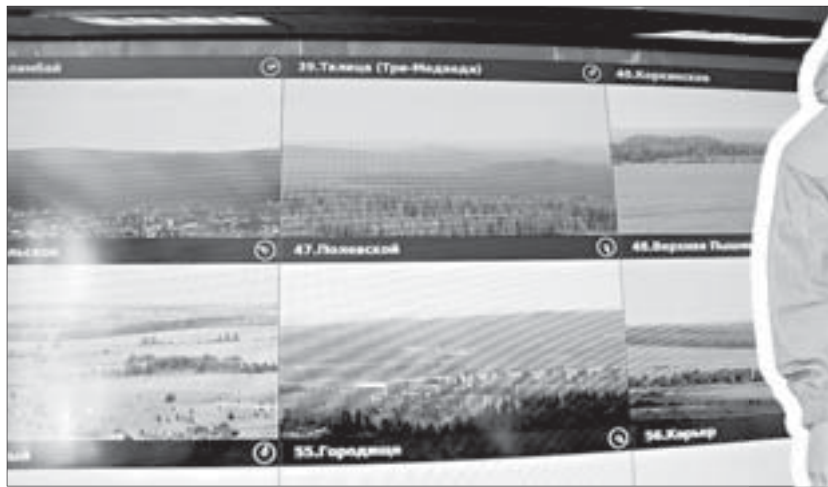
На пожарной видеокarte Свердловской области Полевской обозначен под номером 47