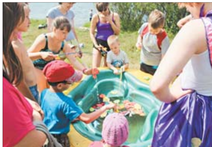
Пока взрослые ловят живую рыбу, дети тренируются на игрушечной