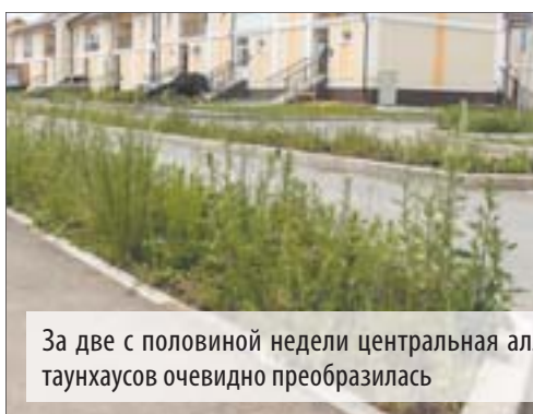
За две с половиной недели центральная аллея таунхаусов очевидно преобразилась