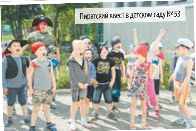
Пиратский квест в детском саду № 53