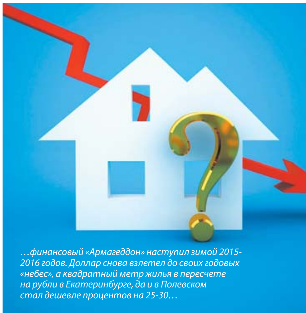
... финансовый «Армагеддон» наступил зимой 2015-2016 годов. Доллар снова взлетел до своих годовых «небес», а квадратный метр жилья в пересчете на рубли в Екатеринбурге, да и в Полевском стал дешевле процентов на 25-30...

Что происходит сейчас? Как говорят эксперты, рынок успокоился и получил характеристику «рынка покупателей». Цены пока остаются низкими из-за возросшего количества предложений. Так, например, однокомнатную квартиру площадью 35-40 м 2 в северной части Полевского можно купить за 1 миллион 100 – 1 миллион 200 тысяч рублей. В южной, соответственно, ещё дешевле: 900-950 тысяч. Отличные предложения можно найти и в Екатеринбурге. Так, однокомнатную в районе Шарташа (33 м 2 ) можно, при желании, найти за