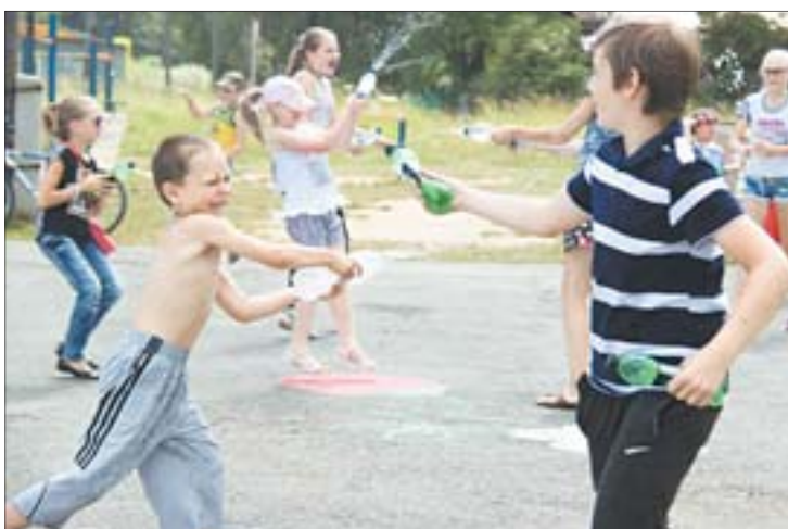
В тридцатиградусную жару дети с удовольствием окатили друг друга водой

Прежде, чем сойтись в хороводе, дети приняли закон: «Угрюмым и грустным вход воспрещён». Закон принят, так скажем, на всякий случай, детского лица без улыбки – не встретить.