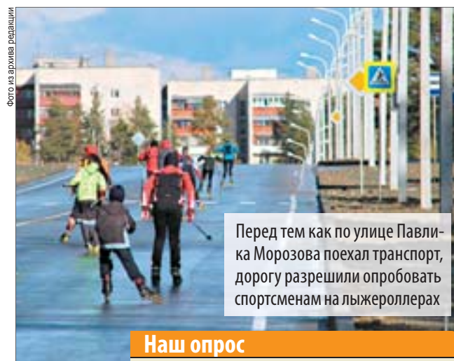
Перед тем как по улице Павлика Морозова поехал транспорт, дорогу разрешили опробовать спортсменам на лыжероллерах