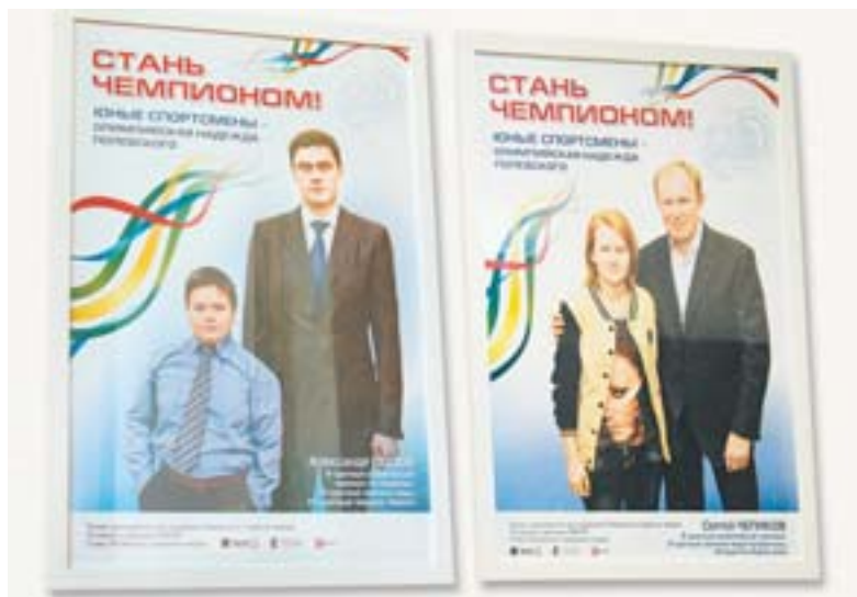
Участники проекта «Стань чемпионом» фотографировались с известными спортсменами

Известные спортсмены рассказали о том, что делается для популяризации массового спорта в Свердловской области