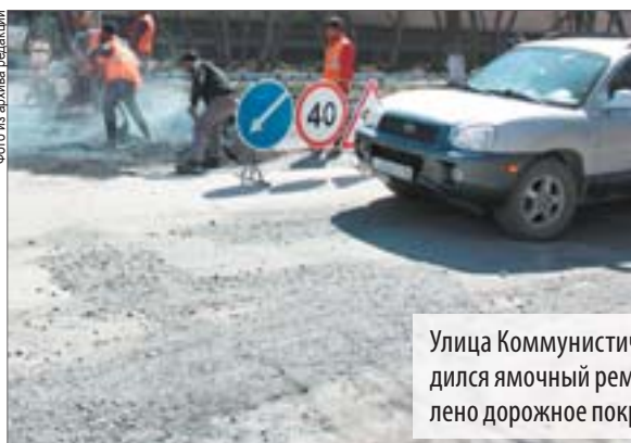
Улица Коммунистическая: до 2014 года здесь проводился ямочный ремонт, в 2014 году полностью обновлено дорожное покрытие от въезда в город до ДК СТЗ