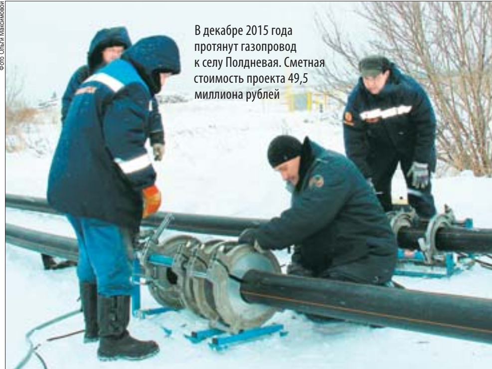
В декабре 2015 года протянут газопровод к селу Полдневая. Сметная стоимость проекта 49,5 миллиона рублей

Надо отметить, что газификация округа будет продолжена и в других районах. К примеру, построен распределительный газопровод по улице Урицкого