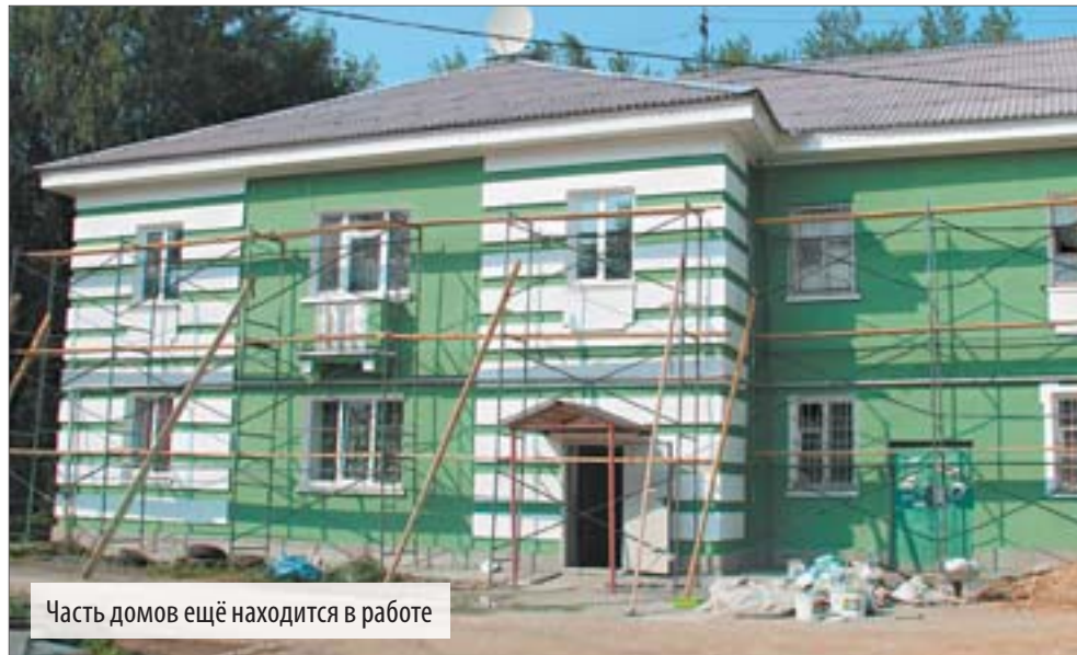
Часть домов ещё находится в работе

Ремонт жилищного фонда города и региона – в центре внимания властей, общественников и обычных граждан