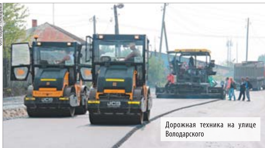
Дорожная техника на улице Володарского