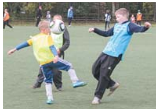
Эмоций на футбольном поле не меньше, чем на сцене театра