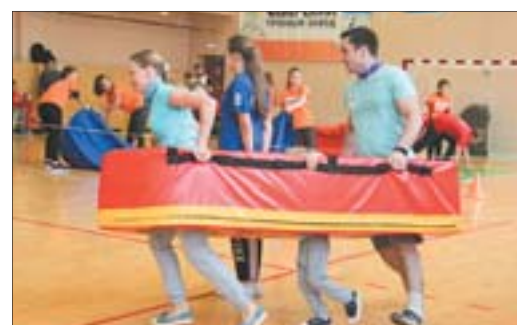
Маленький капитан мчался практически вслепую. Балл за отважность!