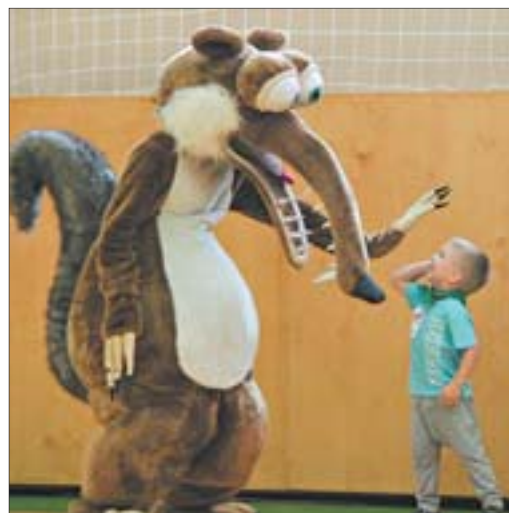
Гвоздь программы – саблезубая белка Скрат. Каждый второй гость праздника с ним поздоровался за руку, каждый третий – сфотографировался

На этапе «Тачки» зрители хохотали до изнеможения. Особенно веселились дети: когда ещё увидишь, как папы ходят на руках, пока мамы держат их за ноги