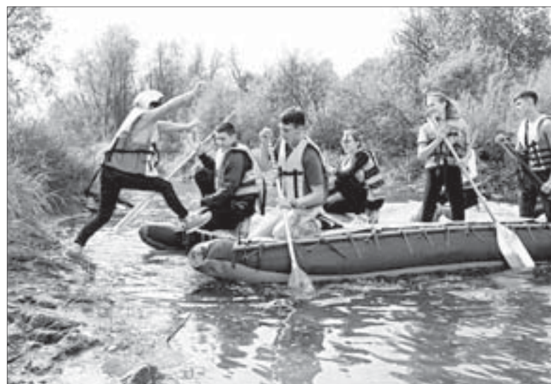
Одним из новшеств стала водная переправа – ребята спасали «тонущего» товарища

Настоящий ажиотаж вызвал у ребят ещё один новый для традиционного турслёта этап, «Веломарафон». Его участники на своих велосипедах преодолели целую полосу препятствий – выполняли упражнения «змейка», «ворота», проезжали по неустойчивым частям дороги.