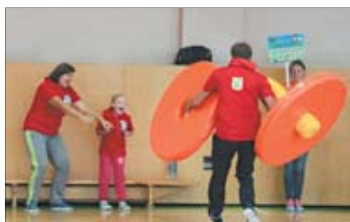
Конкурс «Штанга» – самый быстрый. Основная задача папы – дотащить конструкцию, собранную семьёй, до финиша