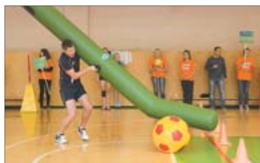
«Гигаклюшка» оказалась невероятно неуправляемой, родителям пришлось хорошо потрудиться, зато детям вручили спортивный инвентарь более привычного размера