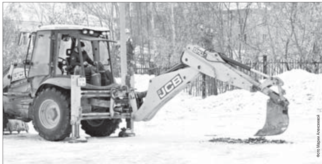
На место строительства пристроя уже прибывают техника и стройматериалы

К концу следующего года будет построен дополнительный корпус школы № 14