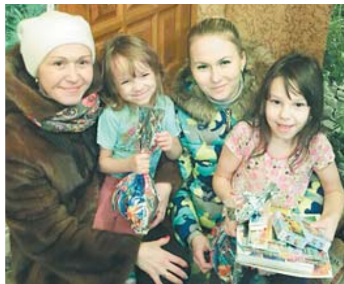
В селе Косой Брод помощницы волонтерской службы «Мамы» поздравили с Новым, 2016 годом детей, оставшихся без попечения родителей

Также есть возможность перечислить денежные средства на карту Сбербанка – 4276816015220468