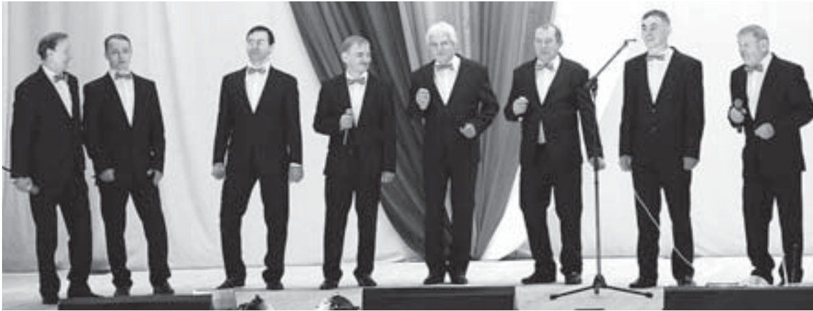
Вокалисты ансамбля «Рифей» во Всемирный день мужчин стали главными звёздами праздника

С концертом «Когда поёт душа» на сцену ЦК и НТ вышли народные коллективы академический хор и мужской вокальный ансамбль «Рифей»