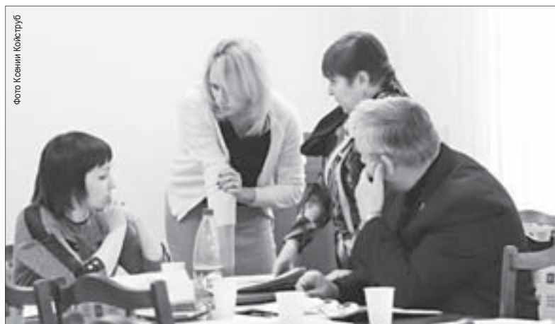
Обсуждение вопросов продолжалось даже во время перерыва

На комитете Думы по соцполитике депутаты обсудили дополнительные меры поддержки нуждающихся в жильё