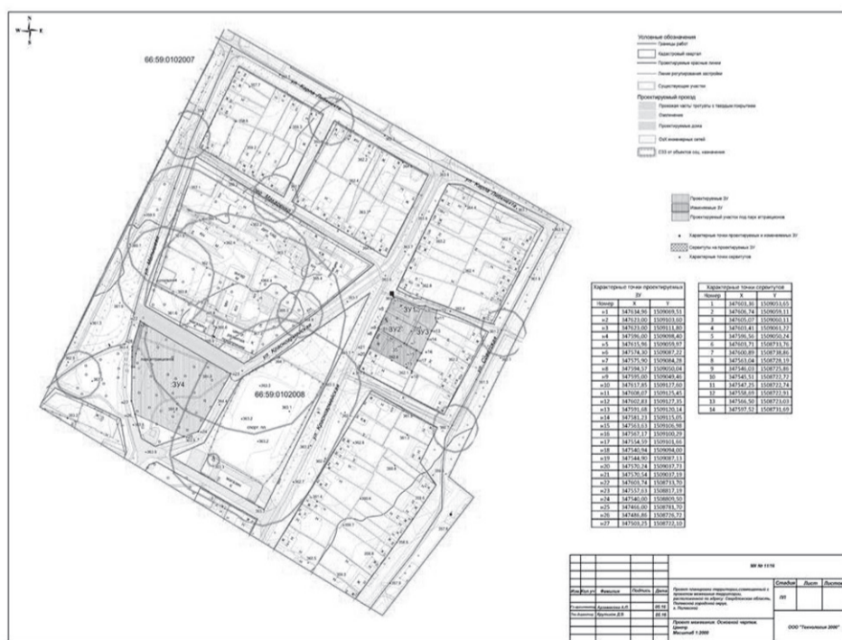
Проект планировки. Основной чертёж