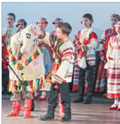
На празднике, посвящённом Году экологии, выступил ансамбль «Перезвоны»