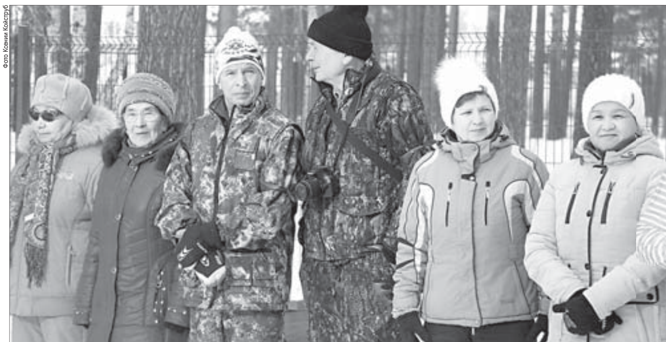
В городском парке развлечений «Полесье» на спортивный праздник собрались представители пяти ветеранских организаций

П олевские ветераны не привыкли сидеть на месте: они утверждают, что с выходом на пенсию жизнь только начинается, ведь появляется столько свободного времени, которое можно уделить близким людям и любимому делу.