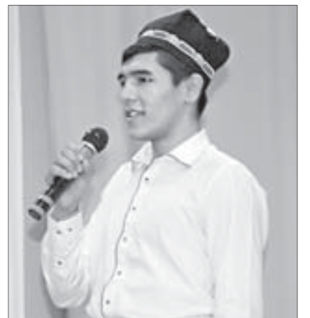
С песнями и танцами Узбекистана гостей праздника знакомили студенты Свердловского областного медицинского колледжа

школы искусств на мастер-классе рисовали иллюстрации к будущей книге «Наш дом – Урал» на тему праздника Навруз.