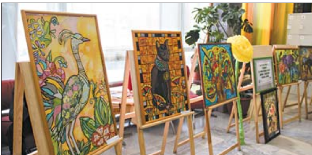
Выставка работ учащихся Детской художественной школы, выполненных в технике батик, украшала фойе Городского центра досуга «Азов» на протяжении всего праздника

Едва за входящим закрыта дверь, с раскрытыми объятиями к нему подбегает белка из мультфильма «Ледниковый период» и предлагает сфотографироваться на фоне живописного пейзажа. Такую необычную встречу гостям устроили в Городском центре досуга «Азов» 15 февраля. Там состоялся праздник, посвящённый Году экологии, «В природе столько красоты». Организатор – Детская художественная школа. В этот день фойе «Азова» превратилось в тропический лес – со слонами, жирафами, павлина-