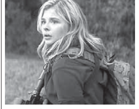
23.15 Х/ф «Красная планета» (16+) 01.15 Х/ф «Дело о Пеликанах» (16+)