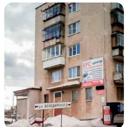
График работы центра – с понедельника по субботу с 10.00 до 19.00.