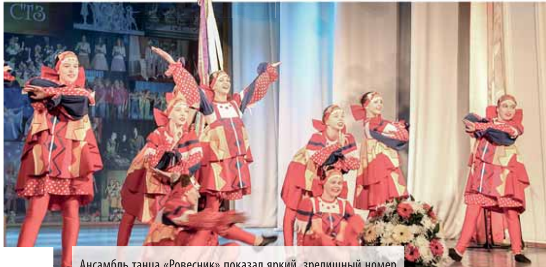
Ансамбль танца «Ровесник» показал яркий, зрелищный номер «Масляная»

— Это удивительно! Наш город не такой большой, а сколько здесь талантливых творческих людей, настоящих профессионалов! Я испытала гордость за родной город. На сцене кипит настоящая жизнь, жаль, что не все мы это видим, — в фойе Дворца культуры Северского трубного завода поделилась своими впечатлениями после праздника зрительница. Женщина не подозревала, что говорила с корреспондентом, но, как нам показалось, выразила мнение, с которым из ДК уходили участники мероприятия.