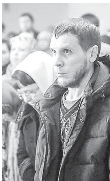
Русский народ выжил, но ценой невероятных жертв

— Главное — не стремиться начинать всё сначала, не желать с позиции силы восстанавливать социальную справедливость, иными словами, топить в крови оставшуюся часть рус-