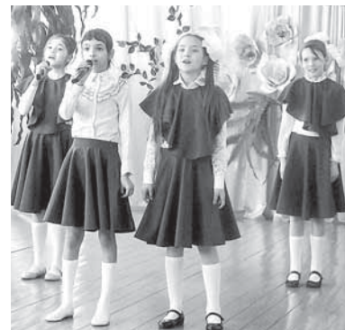
В Полдневой группа «Браво» вышла на сцену в новых костюмах

В Станционном-Полевском, Косом Броду и Зюзельском концерты в рамках фестиваля «Деревня – сердце России» пройдут в ближайшее время. В посёлке Станционный-Полевской – 1 апреля, в селе Косой Брод – 7 апреля, в посёлке Зюзельский – 8 апреля.