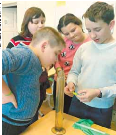
В весенние каникулы в школе № 17 развернулось несколько «исследовательских лабораторий»