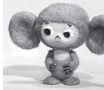
09.00 «Сейчас» (16+) 09.15 «След» (16+) 00.15 Т/с «Каменская» (16+)