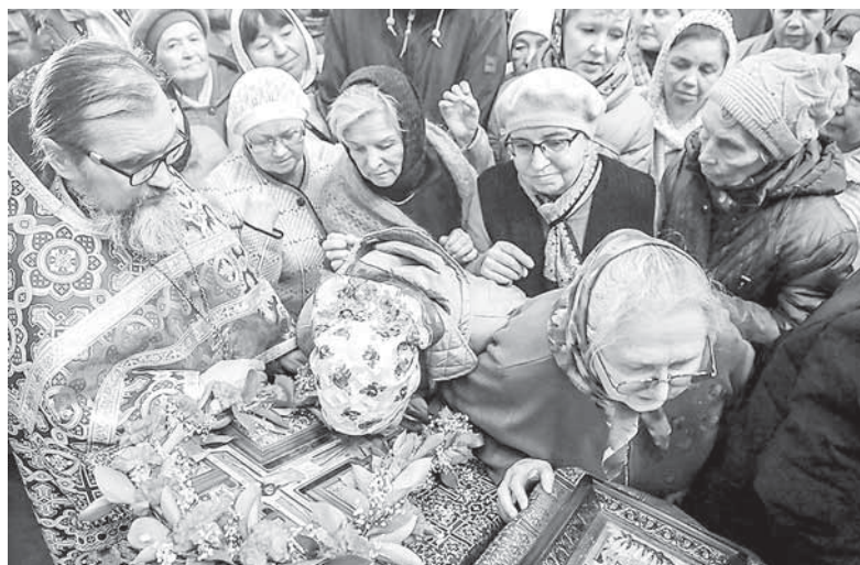
Крест в православии — символ жертвенной любви и смирения, противостоящих вражде и разделению

ния царя в марте 1917 года Бог не дал русскому народу другого вождя и путеводителя. Избрание патриарха в августе 1917 года — это в какой-то мере следствие «обезглавления» народа, которое свершилось ранее.