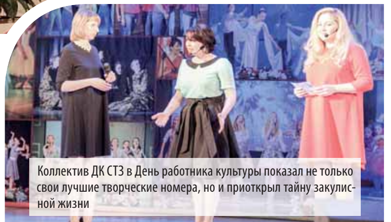
Коллектив ДК СТЗ в День работника культуры показал не только свои лучшие творческие номера, но и приоткрыл тайну закулисной жизни

ских коллективов, но и некоторую часть закулисной жизни, той, где рождается это творчество. Получился настоящий театр, а постановка «Побольше аншлагов и море оваций» завоевала больше зрительское «Спасибо!».