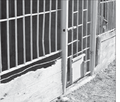
Питомник временного содержания отловленных собак находится по адресу ул. Малышева, 84, телефон 2-33-23. Диспетчер предприятия работает круглосуточно

Содержание, питание, ветеринарное обслуживание каждой обходится муниципалитету в 218 рублей в сутки