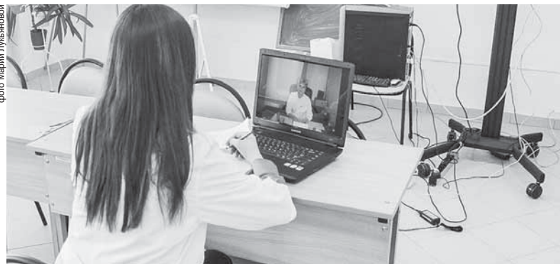
В 2016 году чаще прочих для полевчан проводились телеконсультации иммунолога – их организовано 146

врачи нашей больницы получают возможность учиться у более квалифицированных коллег.