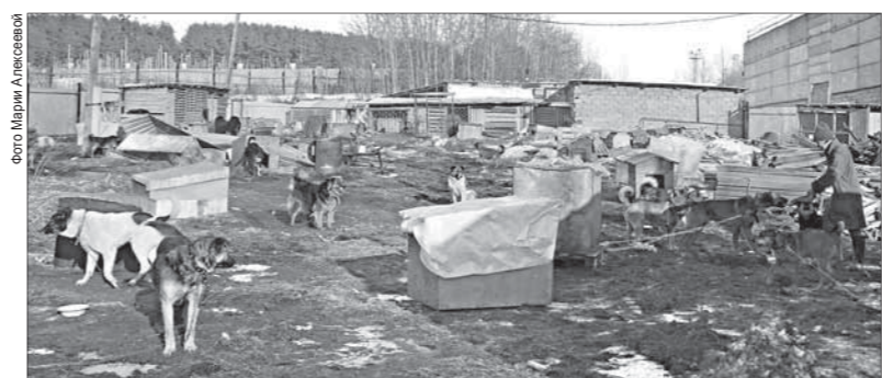
В приюте для бездомных животных фонда «Добрые руки» 230 собак. Они содержатся за счёт благотворительной помощи полевчан и местных предприятий

Согласно контракту, который действует в настоящее время, отловом и содержанием безнадзорных собак занимается Полевская специализированная компания. В апреле будет проведён новый аукцион, на сумму более миллиона рублей на отлов и содержание 61 безнадзорной собаки.