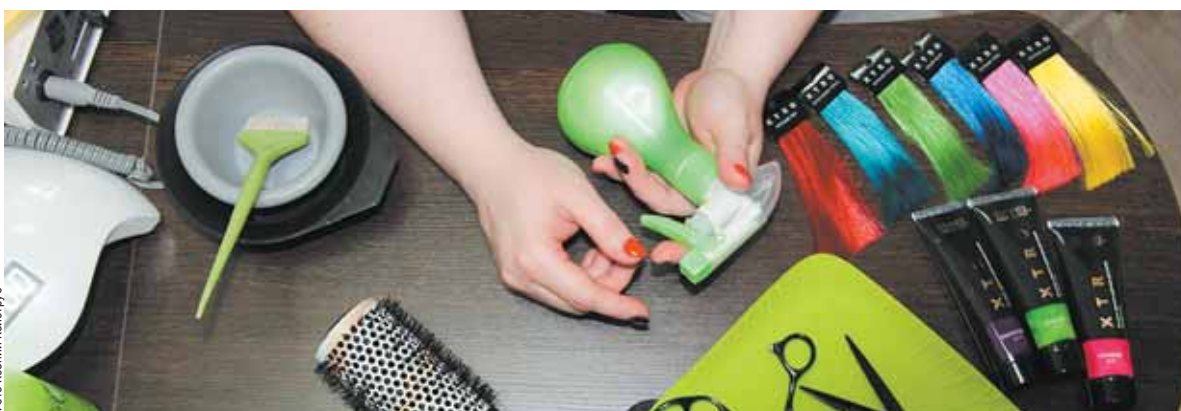
Полосу подготовила Ксения КОЙСТРУБ