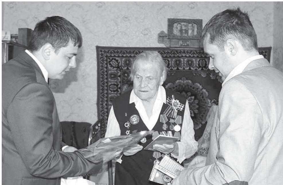
Руководитель Общественного движения «Надёжа» и управляющий директор предприятия «Уралспецзащита» накануне Дня Победы поздравили ветеранов Великой Отечественной войны