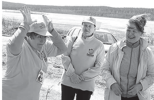
К выполнению заданий участники экоквеста подходят творчески

В рамках «Экологического марафона» планируется проведение ряда городских мероприятий, таких как туристический слёт, благотворительная ярмарка «Время добра» и другие. А стартом акции стал «Экологический квест», в котором приняли участие команды ветеранских организаций СТЗ, ПКЗ, муниципальной службы, медиков, посёлка Зюзельский и села Косой Брод.