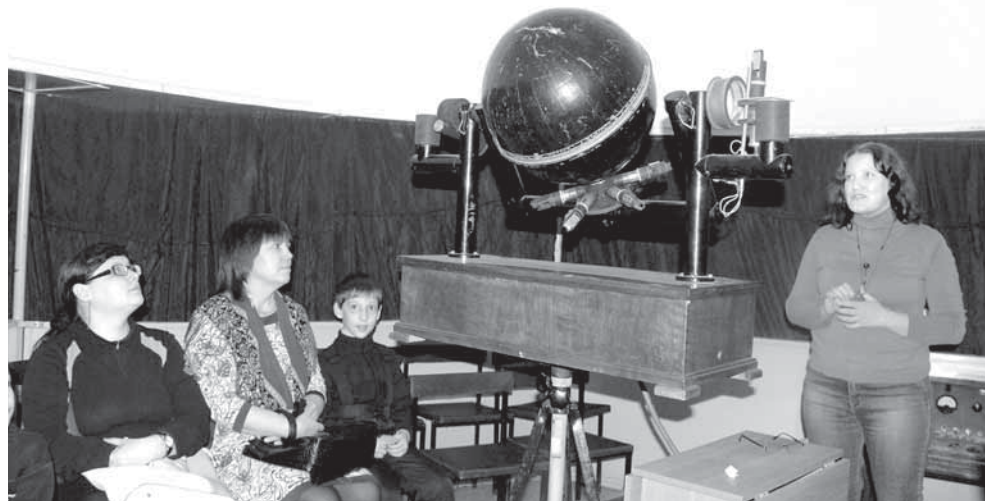
В Полевском краеведческом музее участникам акции объясняют взаимосвязь космоса и экологии

Отличительной особенностью областной акции в этом году станут три экскур-