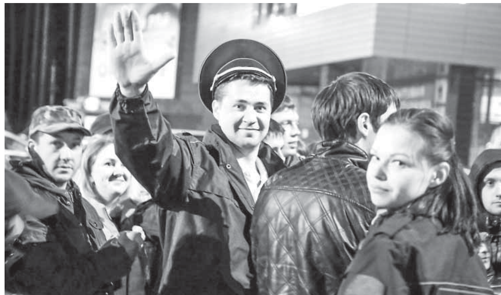
На спасение девушки в рамках игры «Забавы маньяка – 2. Весеннее обострение» выехало 22 команды

Ночью с 13 на 14 мая стартовал летний сезон автоквестов «Ночной дозор»