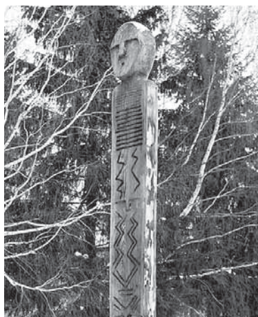
В Нижних Таволгах установлена точная копия древнейшей деревянной скульптуры

– Врио главы региона Евгений Куйвашев уделяется большое внимание сохранению традиционных художественных промыслов. Фестиваль «Тайны самоцветного кольца» пользуется большой популярностью у жителей и гостей Среднего Урала и способствует активному развитию событийного туризма в регионе, – подчеркнул министр промышленности и науки Свердловской области