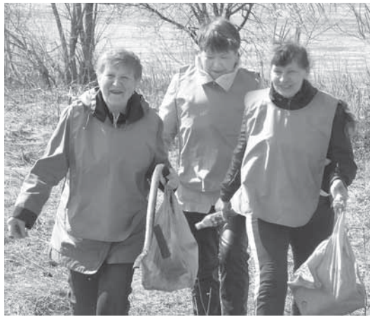
Экстремальным этапом стала уборка территории за короткое время

Ветеранов ожидали необычные испытания. В ходе квеста на различных этапах они должны были разрешить задачи экологической направленности. А находили эти этапы участники квеста с помощью подсказок.