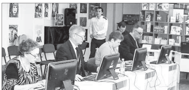
Участниками чемпионата стали пенсионеры в возрасте от 62 до 72 лет из Туринска, Артёмовского, Нижнего Тагила, Кировграда, Полевского и других городов области

Полевчанка стала призёром регионального этапа VII Всероссийского чемпионата по компьютерному многоборью среди граждан пожилого возраста