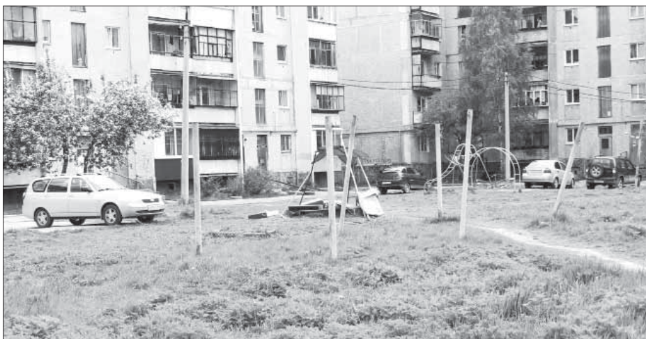
В этом году двор на Карла Маркса, 1, будет благоустроен на деньги из областного и городского бюджетов

– Чтобы сделать города красивыми и уютными, их благоустройство и содержание должны уйти от хаотичности и перейти на единые, современные, разработанные с учётом особенностей каждого отдельно взятого муниципалитета правила и стандарты,