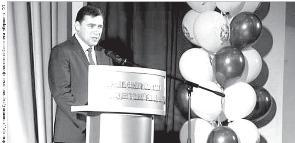
Врио губернатора Свердловской области Евгений Куйвашев напутствовал выпускников филиала Российской академии народного хозяйства и государственной службы

– В преддверии международной промышленной выставки Иннопром на площадке Уральского филиала РАНХиГС пройдёт заседание совета директоров, то есть к нам в гости приедет вся Россия – руководители всех крупнейших филиалов академии. Пла-