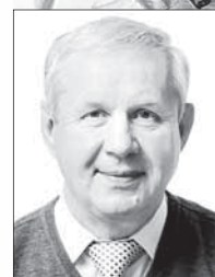
Председатель Думы ПГО О.С. Егоров

День рождения любимого города – действительно всенародный праздник, который объединяет людей разных поколений и разных профессий. Полевской – удивительный город с самобытной культурой и историей, с мастерами людьми, слава о которых запечатлена в литературе и песнях, в нашей памяти и сердцах. Окрестности города привлекают всё большее количество туристов, каждый день мы открываем наш живописный край для себя, всё большее число полевчан осознают ценность нашей земли и природных богатств. Полевской – город людей огненной профессии – металлургов. Исторически вокруг заводов строилась жизнь, династии металлургов составляли трудовую гордость промышленного города. Нас сближает любовь к родному городу, мы всё чаще вместе с вами создаём проекты, которые помогают делать его более комфортным, благоустроенным и красивым. У нас с вами есть всё для этого, а главное – желание работать в интересах своего города и людей, живущих здесь.