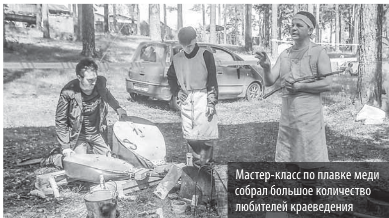
Мастер-класс по плавке меди собрал большое количество любителей краеведения

Но не только глюкофон звучал в эти дни на Азов-FEST-е: порадовал полевчан концерт авторов-исполнителей бардовской песни «Малахитовая гостиная» и магические этнонапевы, которые сопроводили зажжение свечи желаний, отправившейся в плавание по водам Железянского пруда встречать рассвет нового праздничного дня, который обещал не менее интересную и насыщенную программу.