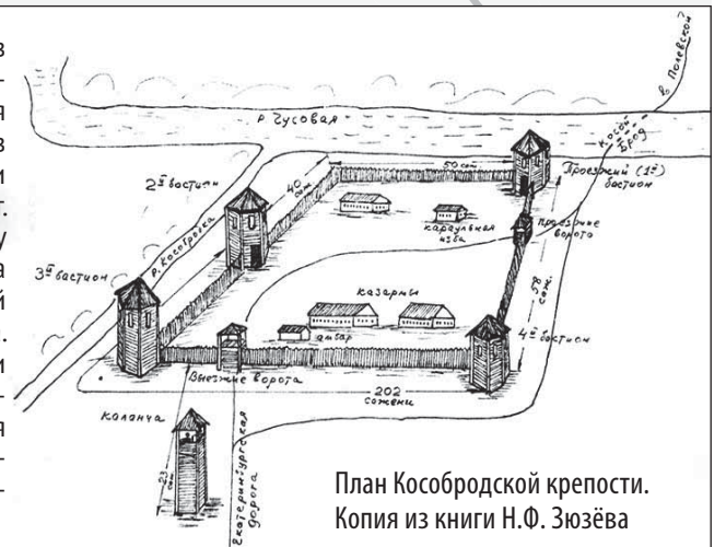
План Кособродской крепости. Копия из книги Н.Ф. Зюзёва

На правом берегу Чусовой в 1723 году построили деревянную крепость с четырьмя башнями – защиту от набегов кочевых племён. В крепости находились казармы солдат. Служащие охраняли дорогу с Гумёшевского рудника на Уктусский завод, по которой перевозилась медная руда. Около стен крепости стали селить крестьян. Со временем крепость стала рушиться и терять своё значение, а селение продолжало называться кособродской крепостью.