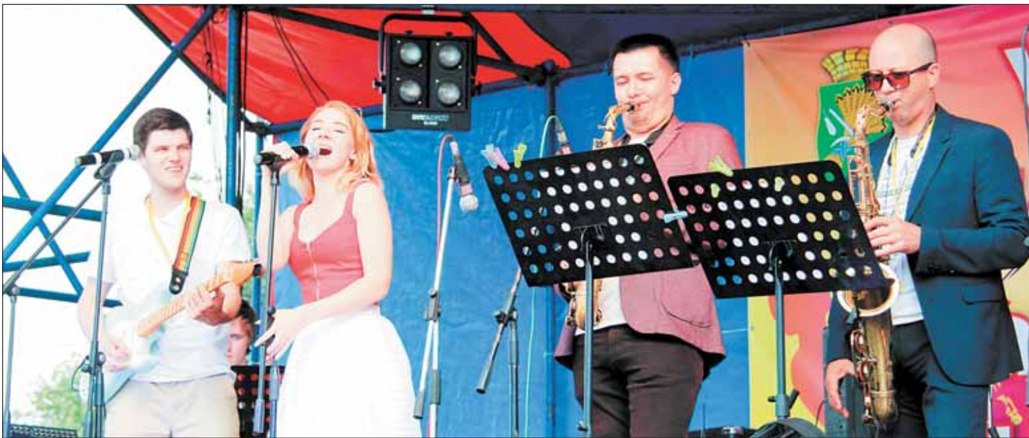
Ural Terra Jazz сейчас седьмой в рейтинге российских джазовых фестивалей