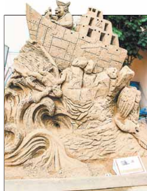
Выставка песочных скульптур на этот раз посвящена Году экологии. Скульпторы из Камышлова и Екатеринбурга постарались образно выразить свои мысли и своё отношение к окружающему миру