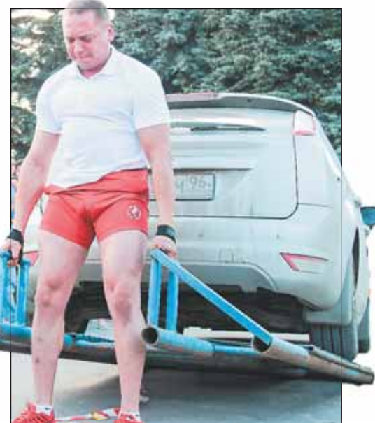
Силачи со всех уголков страны съехались в Камышлов, чтобы помериться мускулами. Самым зрелищным стал момент, когда спортсмены пытались оторвать от земли автомобиль

– Сегодня в области много делается для того, чтобы культура стала ближе каждому жителю нашего региона. Прекрас-