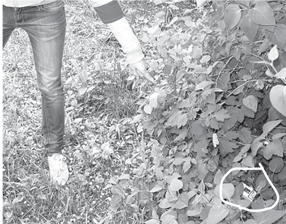
Если в телефоне у вашего ребёнка вы обнаружили подобные фотографии, есть повод серьёзно поговорить с вашим чадом

Иногда путь так запутан, что проходит через несколько сайтов. Конечный портал