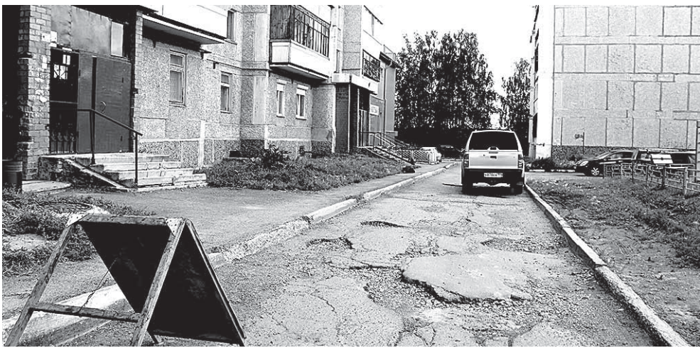
В Зелёном Бору-1, 15, устанавливают три полусферы

В северной части ограничат въезд во дворы многоквартирных домов