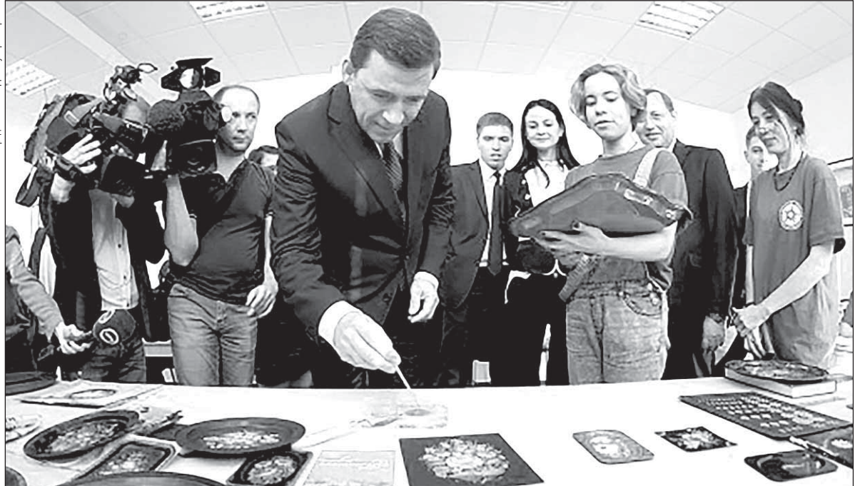
Евгений Куйвашев оставил автограф на одном из подносов, росписью которых занимаются школьники, обучающиеся по направлению «Народные промыслы»

Врио губернатора Свердловской области Е.В. КУЙВАШЕВ