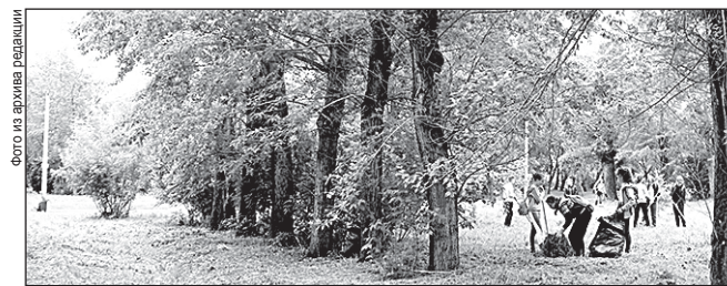
Обновление дендрария под руководством «Молодой гвардии». На субботник выходят жители – и стар, и млад, а также общественные организации

Полным ходом идёт преобразование парка-дендрария, сейчас там работает «Молодая гвардия». В этом году будут убраны аварийные деревья, разбиты зоны отдыха. В следую-