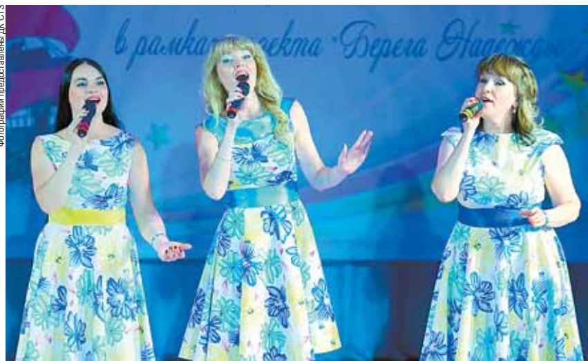
Девушки из вокального коллектива «Ли́ра» порадовали анапских зрителей советскими хитами