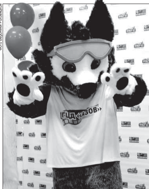
Перед показом мультфильма «Снежная королева-3. Огонь и лёд» аниматоры веселили юных зрителей и приглашали вместе сфотографироваться

В минувшие выходные в регионе на 112 площадках бесплатно показывали четыре фильма – победителя всероссийского голосования: «Время первых», «28 панфиловцев», «Кухня. Последняя битва», а для юных зрителей – «Снежная королева-3. Огонь и лёд».