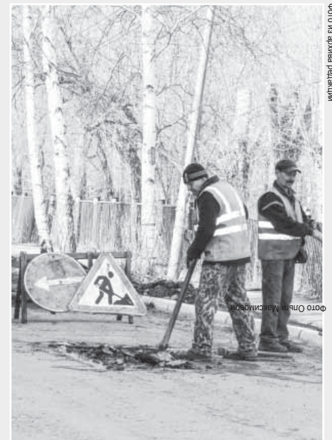
Иллюстрация: Валерия Егоровна

Помимо ямочного ремонта, в сентябре будут капитально отремонтированы улицы Ильича, Советская и Розы Люксембург – на приведение этих улиц в порядок Полевскому выделено 20 милли-