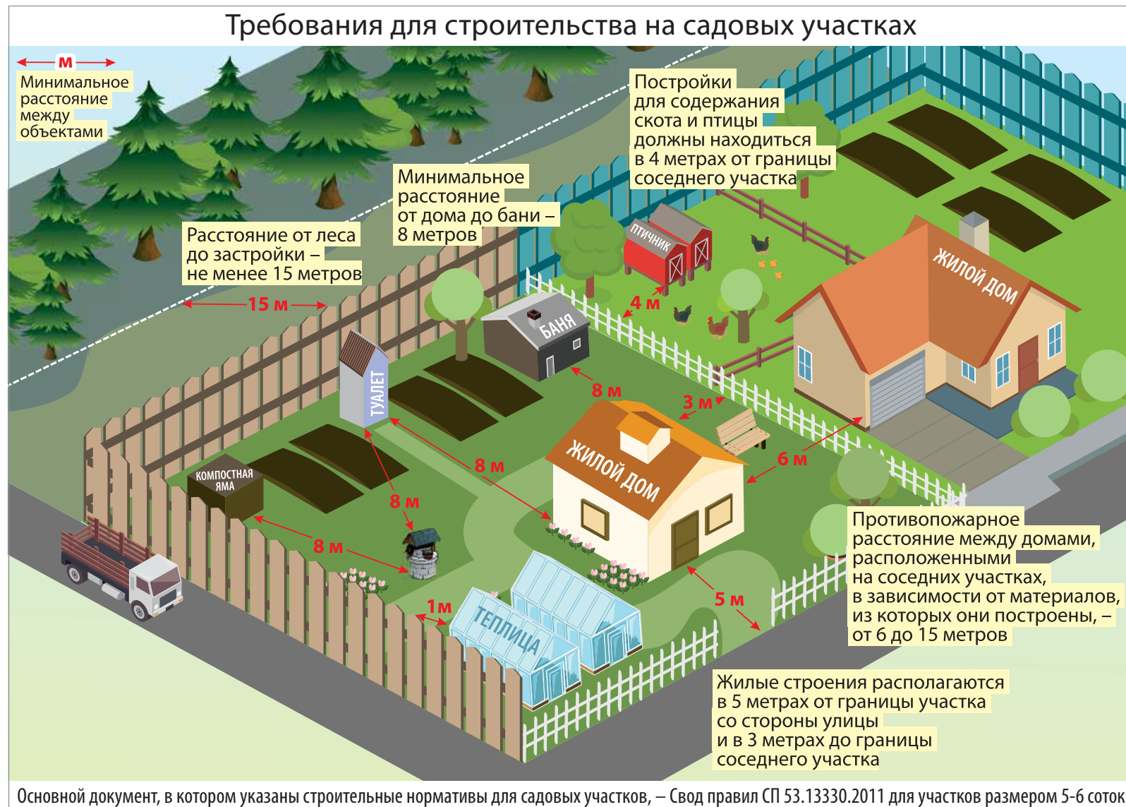
Основной документ, в котором указаны строительные нормативы для садовых участков, – Свод правил СП 53.13330.2011 для участков размером 5-6 соток

На все строения на дачном участке можно оформить право собственности, имея, впрочем, в виду, что у собственника появляется обязанность платить налоги. Если постройки зарегистрированы, то граждане смогут их продать, даже если не соблюдены требования СНиП.