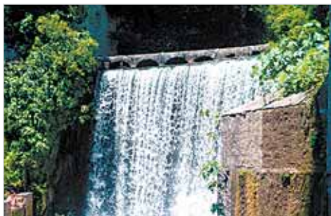
Рукотворный водопад на реке Псырцха