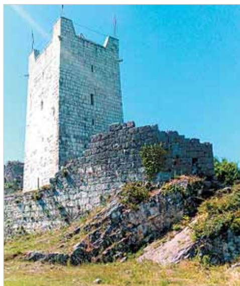
Историко-культурный заповедник «Анакопия»