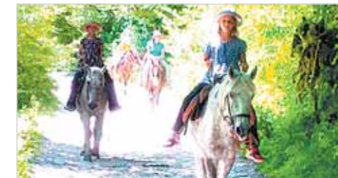
Прогулка на лошадях

Общепит работает на совесть, точек огромное количество: от именитых, с богатой историей ресторанов до семейных кухонек – когда хозяйка заквасила молоко от своей коровки, сварила сыр, с этим сыром напекла хачапуров и приготовила ачму. Освежающее мацони – источник долголетия, домашний сыр разных сортов, из разных видов молока, разумеется, шашлык, разная рыба, свежие фрукты, орехи – «лицо» местной кухни.