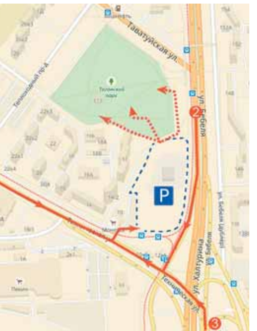
Схема проезда к парковке Парка семейного отдыха «Таганская слобода» (улица Бебеля, 111)

День народов Среднего Урала в этом году пройдет в регионе в 15-й раз. 2 сентября в Екатеринбургской центральной площадке станет Парк семейного отдыха «Таганская слобода».