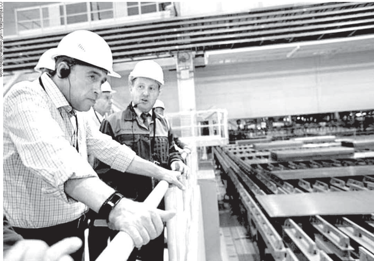
Посетив производственную площадку Синарского трубного завода, Евгений Куйвашев прогнозировал выход предприятия на ещё более высокий уровень

Глава региона Евгений Куйвашев «сверил часы» с руководителями ведущих свердловских предприятий