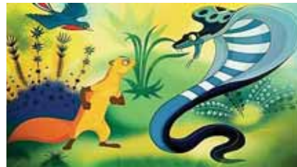
Кадр из мультфильма «Рикки-Тикки-Тави»

Ответы на кроссворд: 1. Карандаши. 2. Антенна. 3. Шторы. 4. Почтальон. 5. Лист. 6. Ананас. 7. Носорог. 8. Карета. 9. Скат. 10. Ложка. 11. Бобёр. 12. Крот. 13. Таз. 14. Кит. 15. Газета.