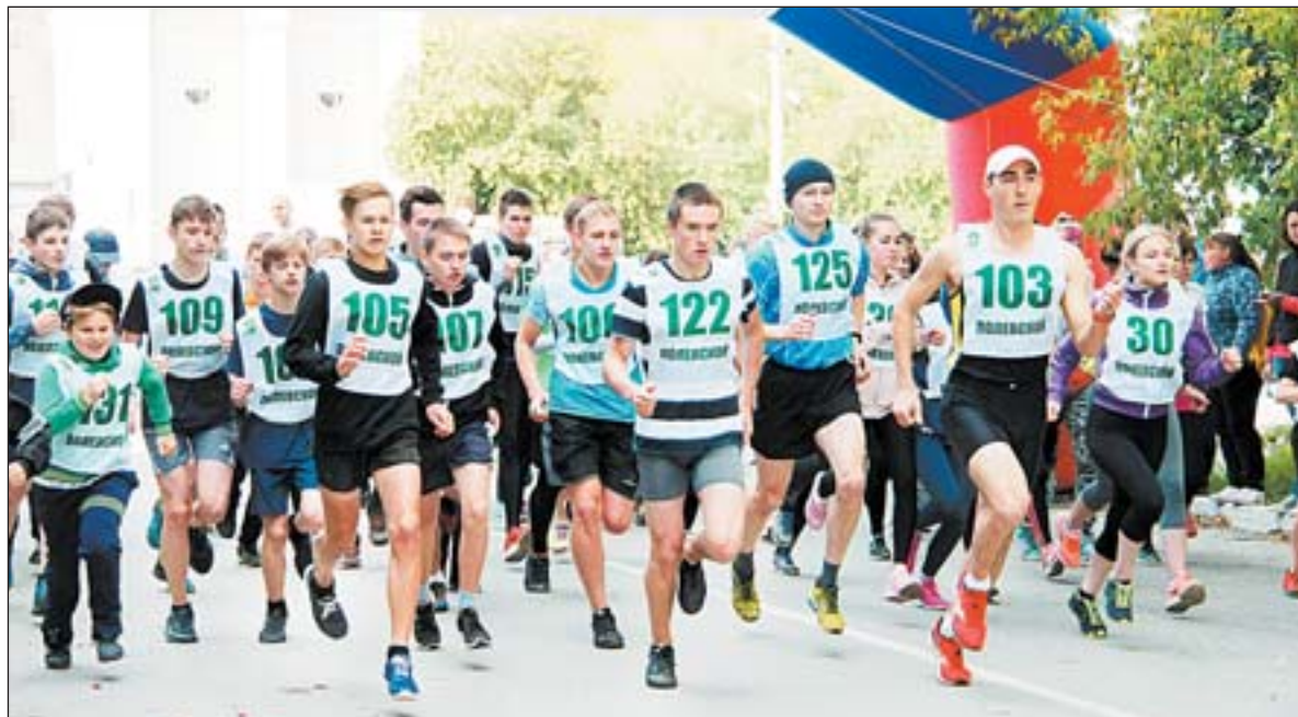
В Полевском в массовом забеге «Кросс нации» приняли участие 1150 человек

«Кросс нации» в столице Среднего Урала в этом году прошёл под знаком подготовки региона к предстоящему Чемпионату мира по футболу. Послы ЧМ – юные футболисты города и области пробежали дистанцию в символике чемпионата.