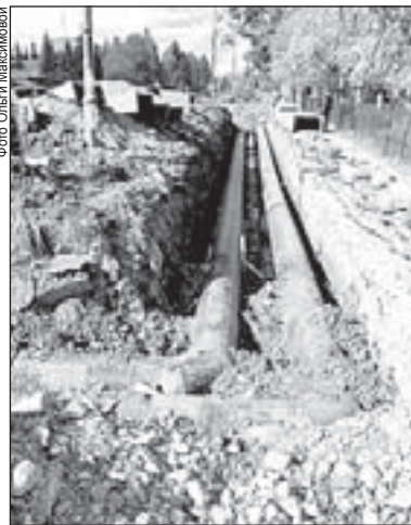
Капитальный ремонт магистральных теплосетей в южной части должен завершиться 21 сентября

– По завершении работ на каждом участке качество оценивает