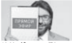
19.00 «60 минут» (12+) 21.00 Т/с «Благие намерения» (12+) 23.15 «Вечер» (12+) 01.55 Т/с «Василиса» (12+) 03.50 Т/с «Родители» (12+)