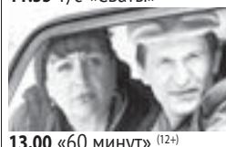
13.00 «60 минут» (12+) 14.55 Т/с «Тайны следствия» (12+) 18.00 «Андрей Малахов. Прямой эфир» (16+) 19.00 «60 минут» (12+) 21.00 Т/с «Благие намерения» (12+) 23.15 «Вечер» (12+) 01.55 Т/с «Василиса» (12+) 03.50 Т/с «Родители» (12+)