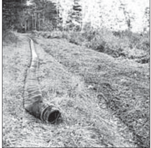
На дороге, ведущей от полигона для складирования свиного навоза до полей, лежит длинный шланг

Напомним, что вопрос с отходами свинокомплекса стоит на повестке много лет,