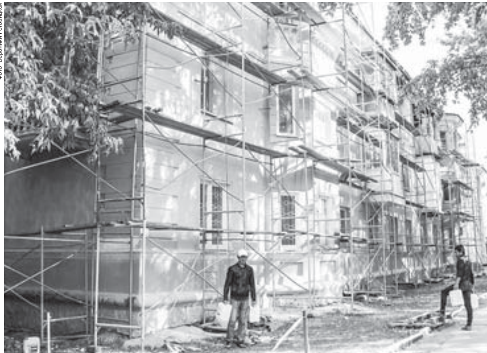
В этом году капремонтам подлежат 23 дома. Ни один пока не сдан. На фото дом на Ленина, 20. В настоящее время там ведётся ремонт фасада

В этом году капитальный ремонт на Среднем Урале проводится в 2447 многоквартирных домах