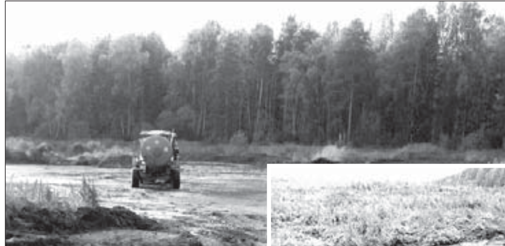
Каждый день на полигон приезжает до десятка машин вместимостью 8-10 кубов с отходами жизнедеятельности свиней. Отходы сливают прямо на площадку

однако никак не решается. Руководство АО «Полевское» по-прежнему утверждает, что все нормы, касающиеся зон санитарной охраны, предприятием соблюдаются.