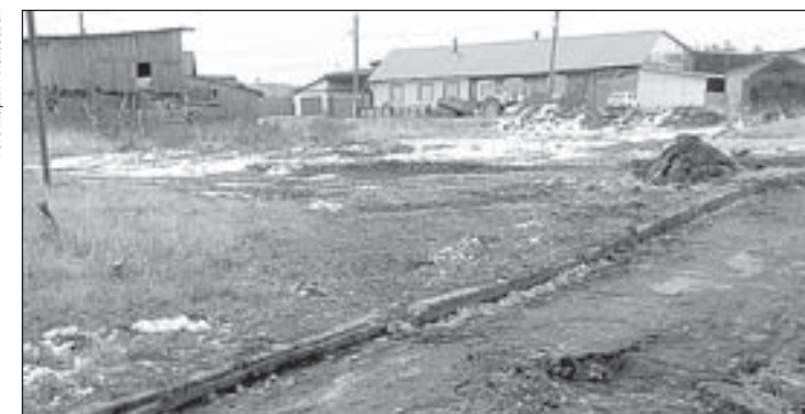
В селе Полдневая на улице Комсомольской в конце октября будет первая благоустроенная детская площадка

За установкой нового детского игрового комплекса с интересом наблюдают жители сразу трёх домов. Новая площадка объединит детвору, живущую на Карла Маркса, 1, и в домах № 1 и 2 Второго микрорайона. Сейчас там уже полностью завершены работы по асфальтированию: все внутренние дороги, въезды и выезды, подходы к подъездам – уже с новым покрытием, а также во дворе появилась новая большая парковочная площадка. В скором времени во дворе сделают новое освещение, будет обустроена зона отдыха со скамейками и урнами.