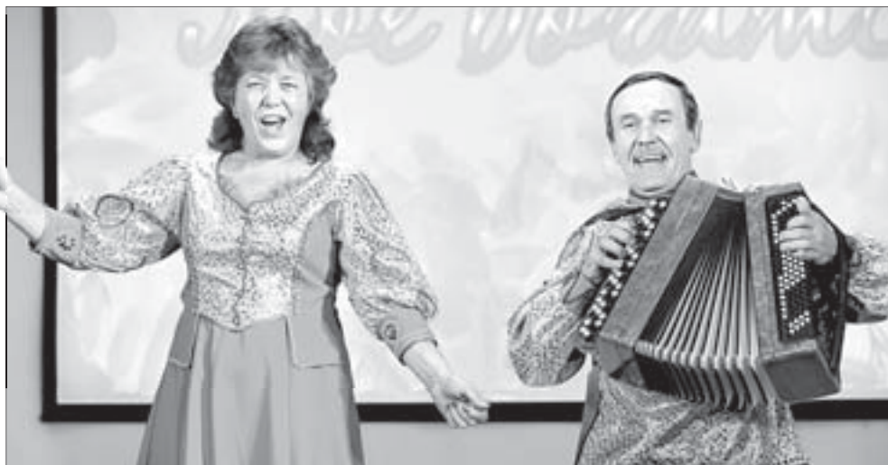
Ветеранские коллективы Полевского показали на фестивале 20 лучших номеров. Сотни зрителей купали в овациях вокалистов и музыкантов, танцоров и чтецов

11 октября на большой сцене Дворца культуры Северского трубного завода состоялся заключительный гала-концерт 1-го городского фестиваля творчества пожилых людей «Мои года – моё богатство»