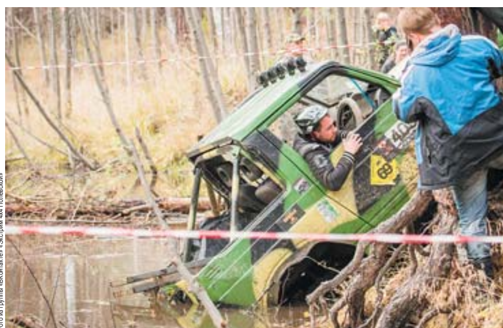
Участники соревновались в трёх классах: «Стандарт», «Туризм» и «Спорт». На прохождение каждого спецучастка давалось не более 15 минут

– У каждого класса была своя трасса: по крутым подъёмам и спускам, через ручей, канаву, яму глубиной 1,5 метра, ямки, выкопанные в шахматном порядке... Самые подготовленные проезжали через бобро-