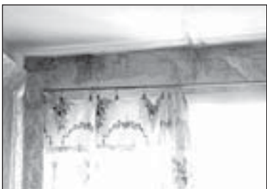
Испорченный ремонт в квартирах пятого этажей не единственная проблема на Бажова, 8А. Состояние навеса и козырьков над балконами требует срочных мер