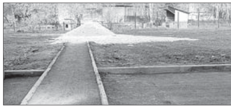
Двор, объединяющий Карла Маркса, 1, и Вторую микрорайон, 1 и 2, уже покрыт новым асфальтом. В скором времени начнётся установка детского игрового комплекса

К концу октября в Полевском откроют две современные дворовые площадки