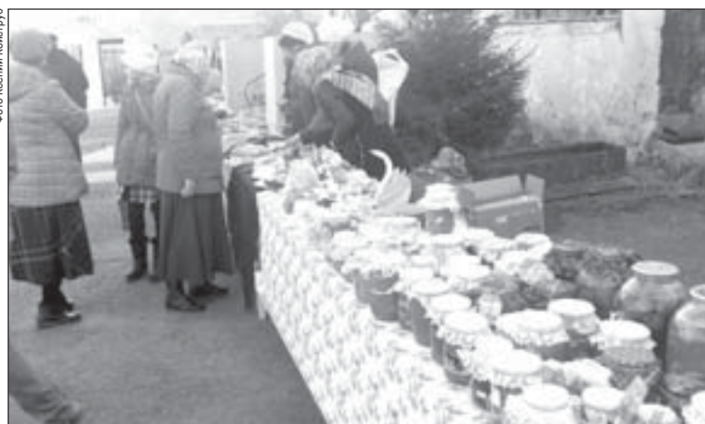
Большой популярностью на Покровской ярмарке пользовались домашние варенья и соленья

В эти выходные православные праздновали Покров Пресвятой Богородицы