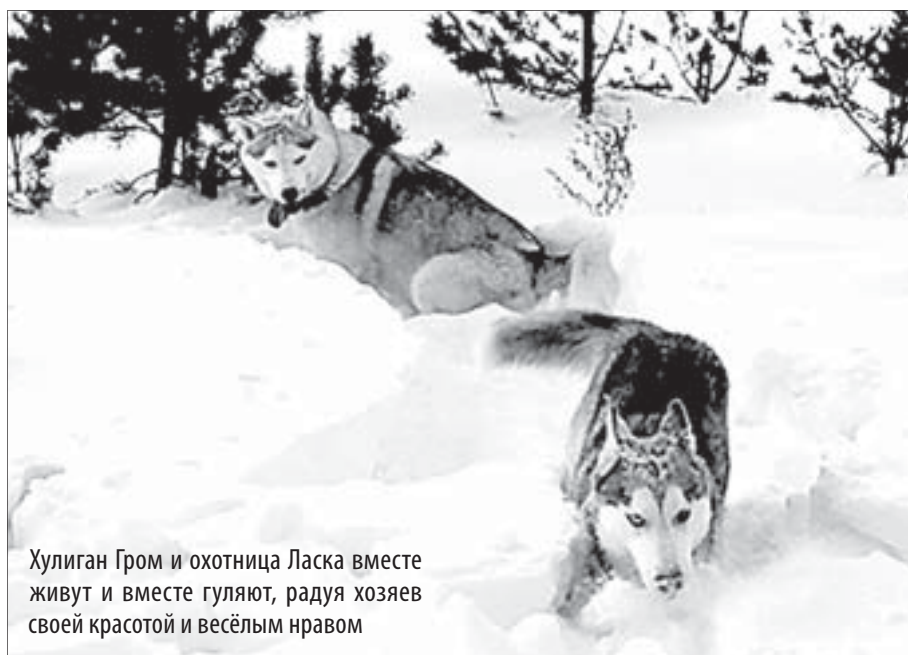
Хулиган Гром и охотница Ласка вместе живут и вместе гуляют, радуя хозяев своей красотой и весёлым нравом