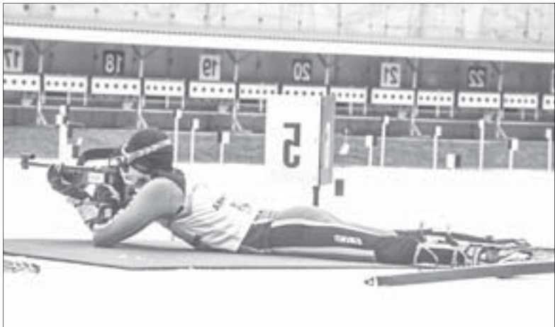
В биатлоне важно следить за дыханием, уметь концентрироваться, чтобы точно стрелять по мишеням после гонки

В Полевском появились первые звёздочки биатлона – перешедшие в этот вид спорта из лыжных гонок