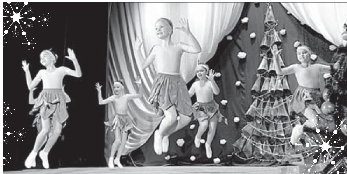
Артисты из танцевального коллектива «Апельсин» перевоплотились в обезьянок, которые ждут Новый год

В Полевском прошла череда новогодних детских праздников