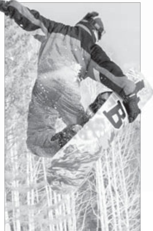
Катание на доске – это в первую очередь адреналин и чувство полёта

– Так как занятия происходят в зимнее время года, на свежем воздухе и при достаточно низкой температуре, они способствуют закаливанию организма, – говорит спортс-