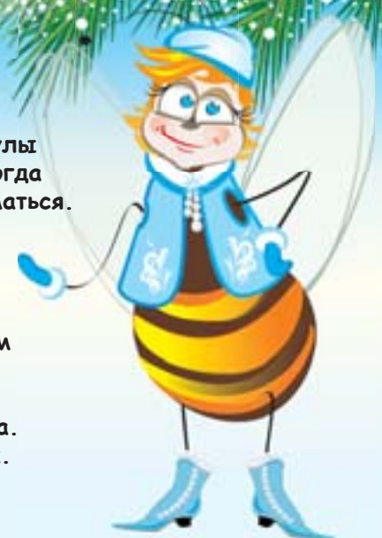
Партнёр рубрики «Детская площадка» ИП Медведев

Привет, ребята! Школьные каникулы в разгаре, но иногда можно и позаниматься. А ну-ка, кто из вас правильно расставит слова, соответствующие картинкам, в этом кроссворде? Первое слово я уже вписала сама. Жду ваши ответы.