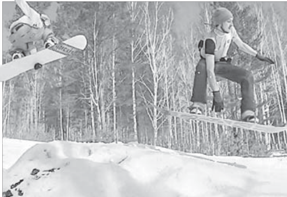
Излюбленное место полевских сноубордистов – гора Высокий Столб