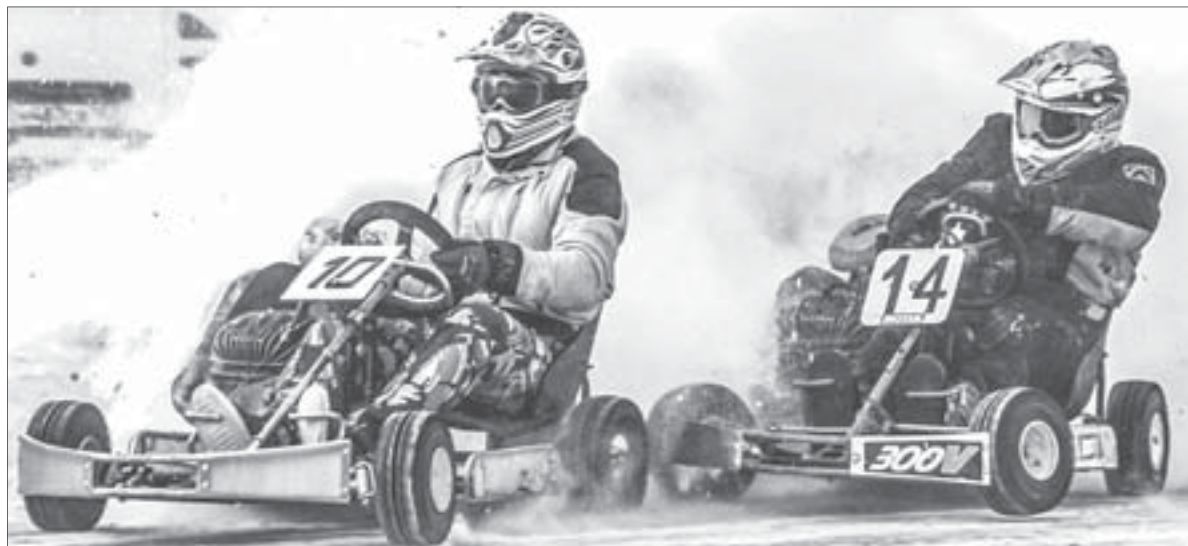
Полевские спортсмены показали хорошие результаты в пяти классах

Самым маленьким пилотом команды по-прежнему остаёт-