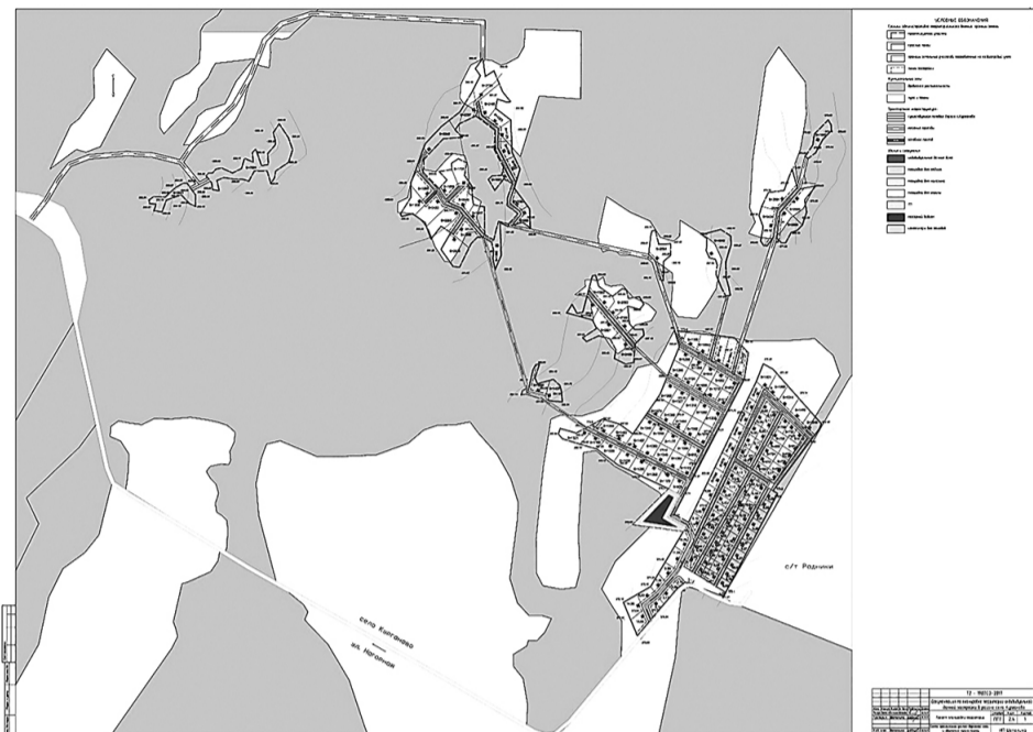
Схема организации улично-дорожной сети и движения транспорта (шифр проекта Т1-1907СО-2017)

УТВЕРЖДЕНА постановлением Главы Полевского городского округа от 02.03.2018 № 282 «Об утверждении документации по планировке территории индивидуальной дачной застройки в районе с. Курганово»