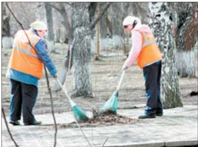
Несколько лет по муниципальным контрактам «Агроцвет» обеспечивает чистоту улиц города