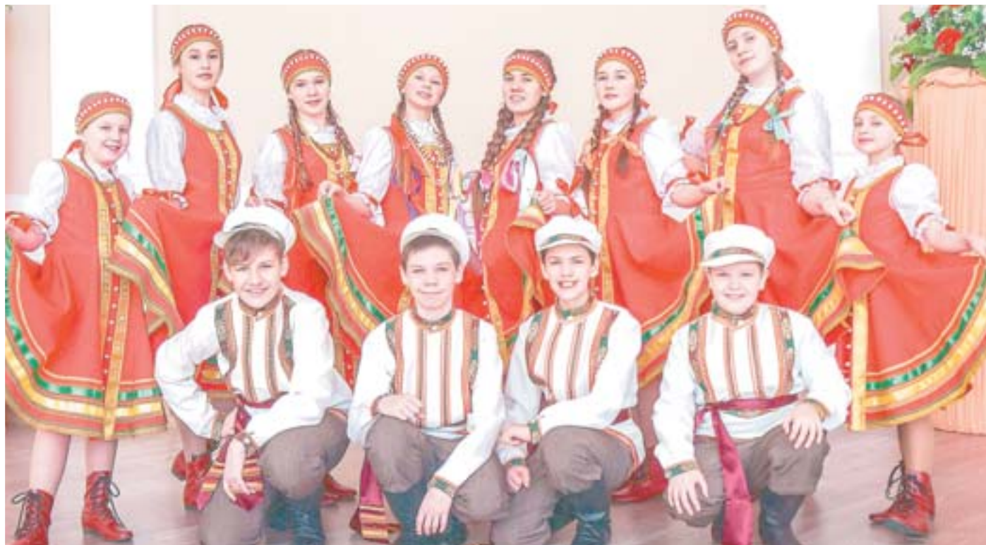
Ансамбль готовится к выступлению на конкурсе-фестивале народного творчества «Русская матрёшка», который состоится в Москве

Журналист побывал в гостях у детского ансамбля народной песни «Дарёнка», узнал о творческих планах и о том, откуда любовь к русской песне у руководителя коллектива