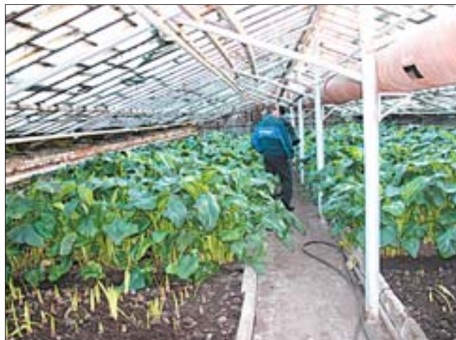
Тепличное хозяйство «Агроцвета» занимает площадь в 4000 квадратных метров