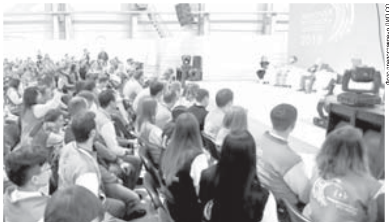
В Нижнем Тагиле Владимир Путин и Евгений Куйвашев приняли участие в VI Всероссийском форуме рабочей молодёжи