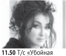
11.50 Т/с «Убойная сила» (16+) 23.55 «Большая разница» (16+)

История одной водонапорной башни » с. 18