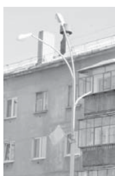
Также на комитете обсудили ремонтные работы электросетевого комплекса. «Облкоммунэнерго» поменяли 9 счётчиков. На фото отремонтированный фонарный столб на улице Коммунистическая, 2

За аудитом должно последовать проектирование и строительство электросетевого комплекса. Как это будет происходить,