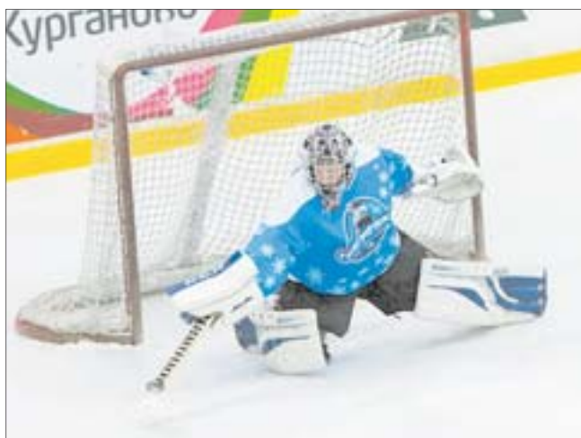
Вратарям приходилось непросто: шайбы то и дело летели в ворота

В «Курганово» прошёл второй этап игр Лиги женского хоккея