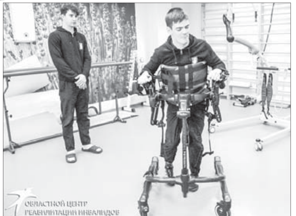
Ежегодно Областной центр реабилитации инвалидов обслуживает более 1600 человек

Так, в рамках реализации пилотного проекта 70 учреждений Свердловской области в прошлом году закупили различное оборудование, которое поможет расширить спектр и повысить качество реабилитационных услуг. Одним из них