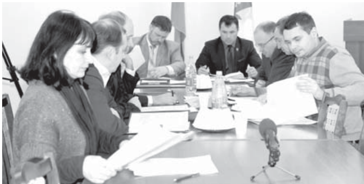
На заседании комитета Думы ПГО по городскому хозяйству и муниципальной собственности снова в центре внимания депутатов оказалось теплоснабжение южной части

Сделать вывод не составило труда: деньги с жителей взяты – приборы не установлены – начисления приходят по нормативу.