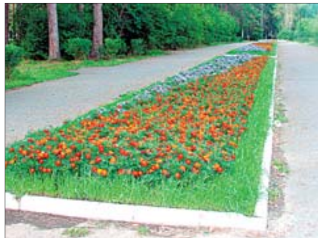
На площадях и в парках специалисты «Агроцвета» высаживают цветы