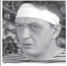
Крепким парам и лучшим мамам » с. 7