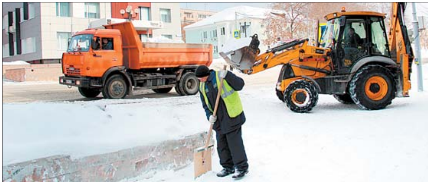
По одному из контрактов «Агроцвет» чистит дороги и тротуары на территории Северского трубного завода