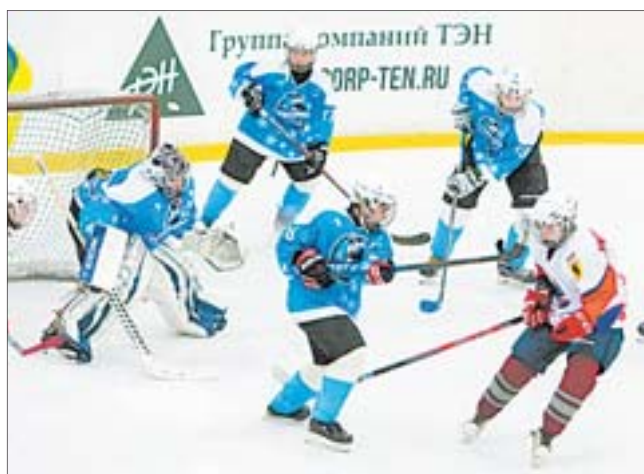
Первые места в групповых баталиях заняли «Северянка» из Череповца и «Первомайские львицы» из Челябинска