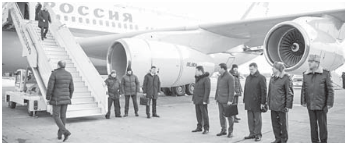
В аэропорту Кольцово президента страны встретили губернатор Свердловской области Евгений Куйвашев и полномочный представитель президента в УрФО Игорь Холманских

В аэропорту Кольцово президента страны встретили губернатор Свердловской области Евгений Куйвашев и полномочный представитель президента в УрФО Игорь Холманских . Сразу из аэропорта на вертолёте Владимир Путин отправился в Нижний Тагил, где посетил Научно-производственную корпорацию «Уралвагонзавод», пообщался с рабочими предприятия и принял участие в VI Всероссийском форуме рабочей молодёжи. После посещения завода глава государства в Екатеринбурге провёл совещание по вопросу развития системы среднего профессионального образования.