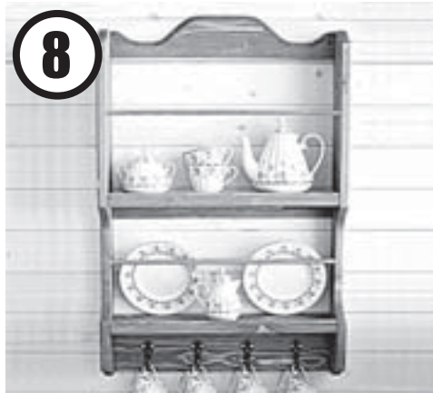
8 Вешаем на кухне открытую полку для посуды

В помещениях с низкими потолками можно покрасить стены в несколько цветов: внизу сделайте полоску самого тёмного, насыщенного оттенка, выше используйте тон посветлее, ещё выше, ближе к потолку – самый светлый. Эта хитрость поможет визуально приподнять потолок. Можно изменить тактику и использовать плавный цветовой переход от тёмного к светлому.