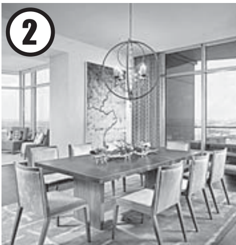
2 Вешаем над обеденной зоной новую люстру