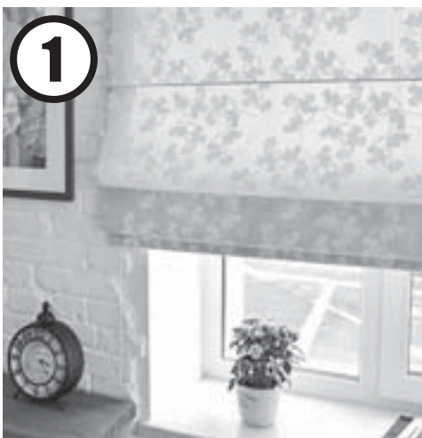
1 Избавляемся от тяжёлых штор

С помощью дизайнера интерьера Анастасии Братиловой мы проанализировали самые популярные способы привнести в жилое пространство дух перемен без капитальных ремонтов и больших затрат.