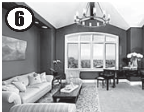
6 Перекрашиваем стены в насыщенный цвет

экспериментам, просто обновите напольную плитку в ванной. Не сомневайтесь: интерьер изменится до неузнаваемости.