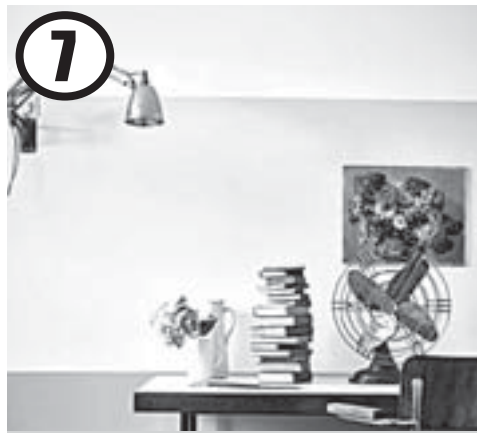
7 Визуально приподнимаем низкий потолок при помощи покраски стен

Когда в комнате достаточно естественного освещения, не бойтесь красить стены в яркие, насыщенные цвета. Это лёгкий способ придать интерьеру характер и выразительность. Например, если ваши окна смотрят на парк или выходят в сад, то выбирайте глубокий зелёный оттенок. В качестве контрастного цвета подойдёт ярко-жёлтый, в который можно добавить сочные пятна.