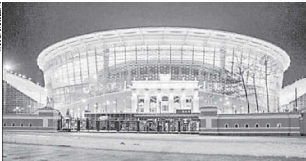
Вместимость нового стадиона – 35 тысяч зрительских мест. Спортивный комплекс оборудован надёжной системой безопасности и видеонаблюдения. Обустроены скайбоксы и ВИП-трибуны. Для прессы оборудован комментаторский блок, пресс-центр и рабочие помещения

Губернатор Евгений Куйвашев отметил, что к Кубку конфедераций FIFA 2017 года и Чемпионату мира по футболу FIFA 2018 года в 11 городах-организаторах шло