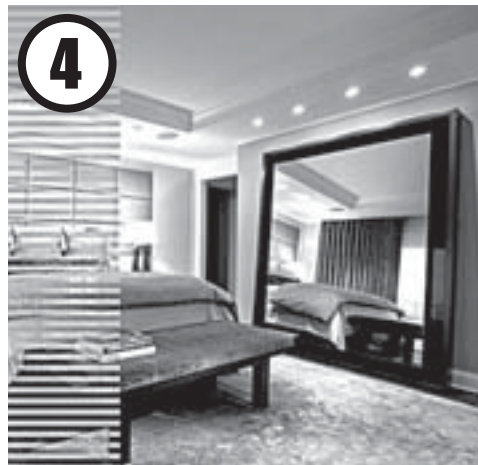
4 Ставим в спальне большое напольное зеркало

Прихожая – это часто очень тёмное и тесное помещение. Спасать ситуацию помогут обои с каким-нибудь эффектным орнаментом, которыми я предлагаю оклеить одну из стен. Абстрактный геометрический рисунок сразу привлечёт к себе внимание и, если это необходимо, поможет визуально расширить узкую прихожую. Как вариант, можно использовать лёгкие фотообои с не громоздким рисунком.