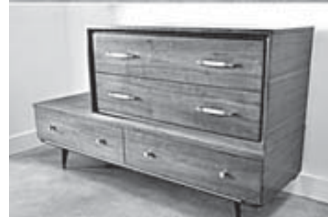
9 Делаем из старой мебели новую

Новая мебель – хороший способ поменять интерьер. Но более креативно и экономно преобразить старую мебель можно, покрасив её в актуальные цвета, нанеся при помощи трафарета принт, обновив обивку, добавив модного декора или антикварного эффекта. Мебели, пришедшей в негодность, можно подарить вторую жизнь, смастерив из неё что-то новое. Даже замена фурнитуры (в том числе дверных ручек) придаст интерьеру новизны.