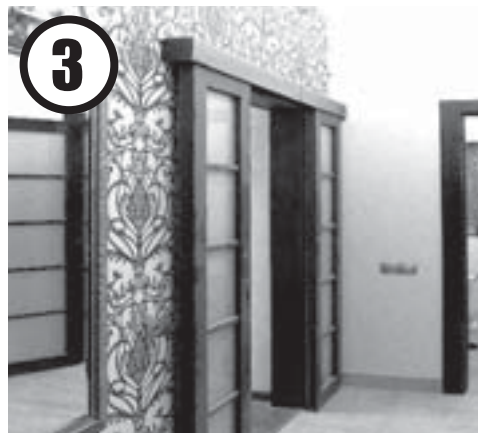
3 Пусть одна стена в прихожей будет акцентная

лярен. Также отлично вписываются фактически в любой интерьер абажуры из ткани.