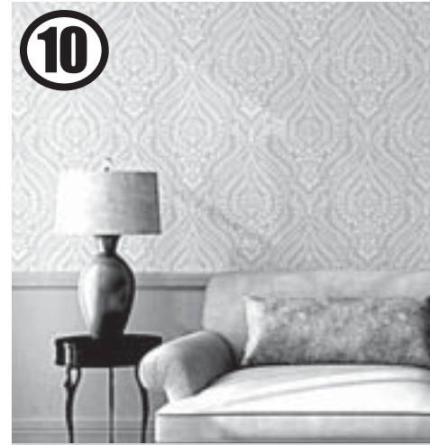
10 Если сомневаетесь и не знаете, с чего начать, просто переклейте обои

Новая мебель – хороший способ поменять интерьер. Но более креативно и экономно преобразить старую мебель можно, покрасив её в актуальные цвета, нанеся при помощи трафарета принт, обновив обивку, добавив модного декора или антикварного эффекта. Мебели, пришедшей в негодность, можно подарить вторую жизнь, смастерив из неё что-то новое. Даже замена фурнитуры (в том числе дверных ручек) придаст интерьеру новизны.