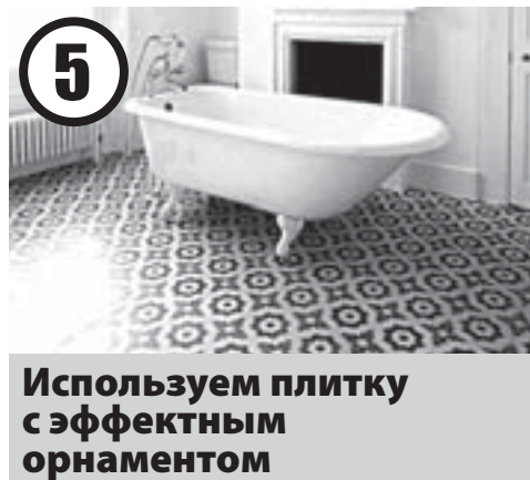
5 Используем плитку с эффектным орнаментом

Не забывайте о преимуществах зеркал! В спальне не будет лишним напольное зеркало в красивой массивной раме. Достаточно просто прислонить его к стене. Сориентируйте его таким образом, чтобы оно отражало естественный свет, который льётся из окна, и подсвечивало тёмные уголки комнаты.