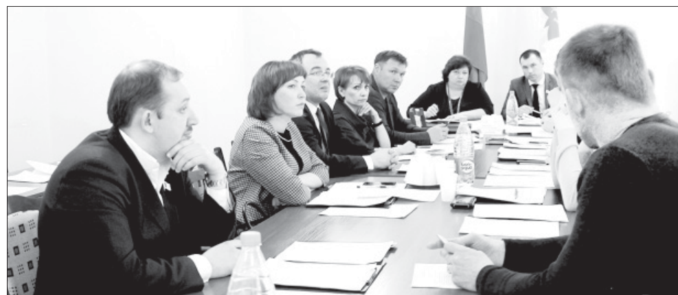
Куда обращаться родителям за помощью детского психиатра, разбирались депутаты Думы ПГО на совместном заседании комитетов по социальной политике, городскому хозяйству и муниципальной собственности

Депутаты обсудили оказание психиатрической и наркологической помощи детскому населению Полевского