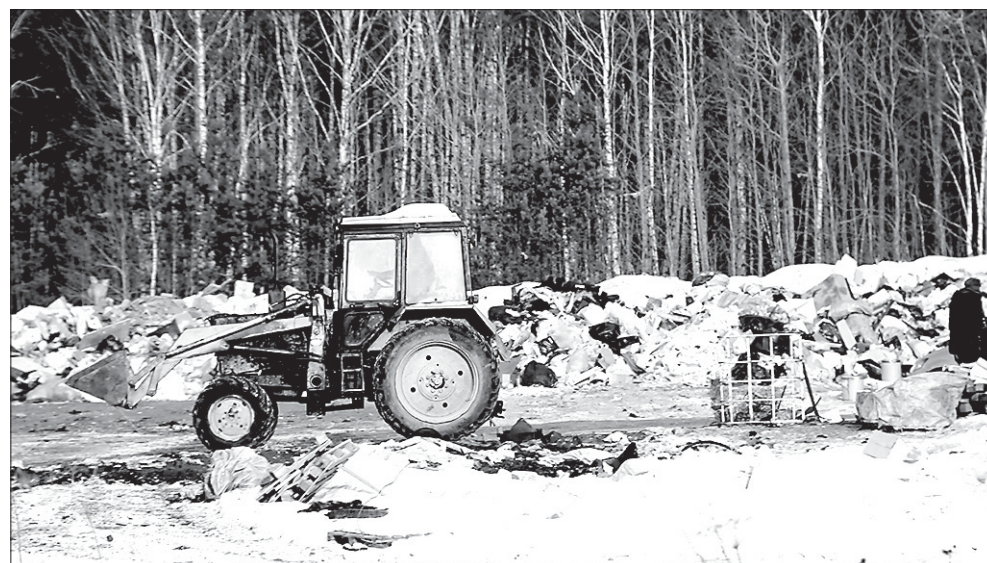
На полигоне «Возрождении» будут принимать безопасные отходы пятого класса. В дальнейшем здесь останется пункт сортировки и перегрузки

– Это будет ясно после выбора регионального оператора. Региональный оператор в Восточном округе назвал цифру – сколько, по прогнозам, будут платить жители на этой территории, – 116 рублей с человека в месяц. Каков тариф будет в Западном округе, станет понятно после конкурса. Но нормативы потребления для Полевского Региональная энергетическая комиссия уже установила.