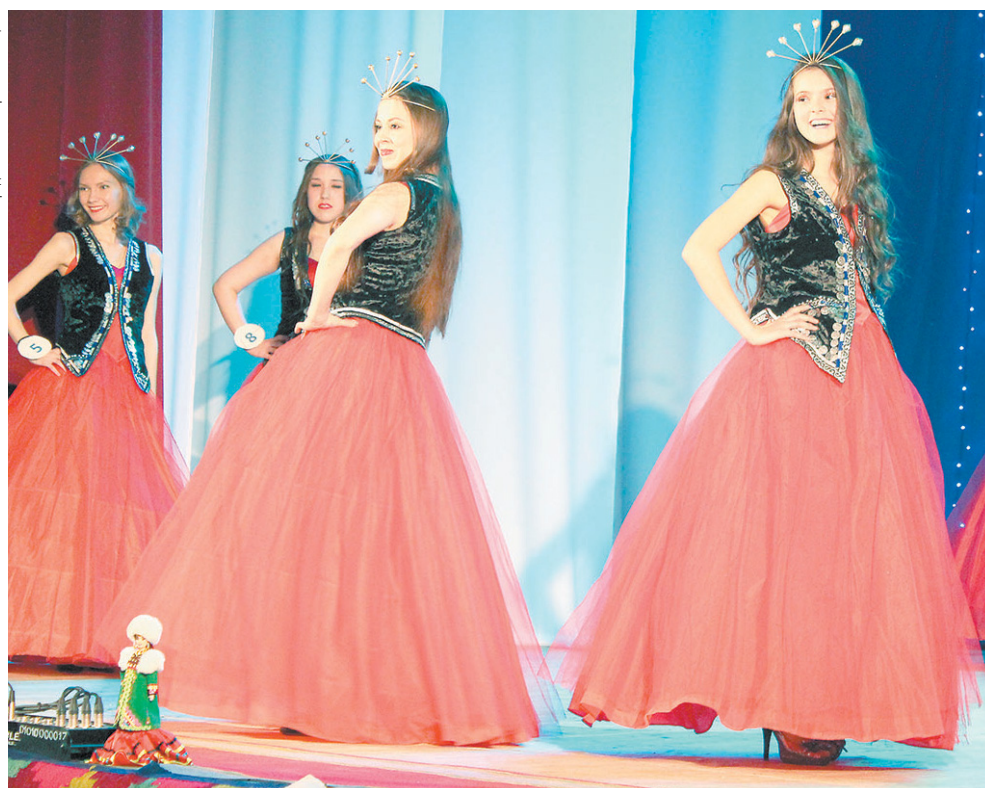
Финал конкурса состоял из «визитной карточки», творческого номера и дефиле в трёх нарядах

На финале девушки показывали «визитную карточку», творческий номер и дефиле в трёх нарядах. Оценивало