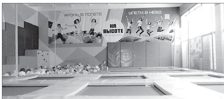
Надзорные ведомства выдали предписания и определили сроки для устранения нарушений

В результате проверки выявлены следующие нарушения: отсутствуют ответственные за пожарную безопасность, не утверждена инструкция о мерах пожарной безопасности, невозможно свободное