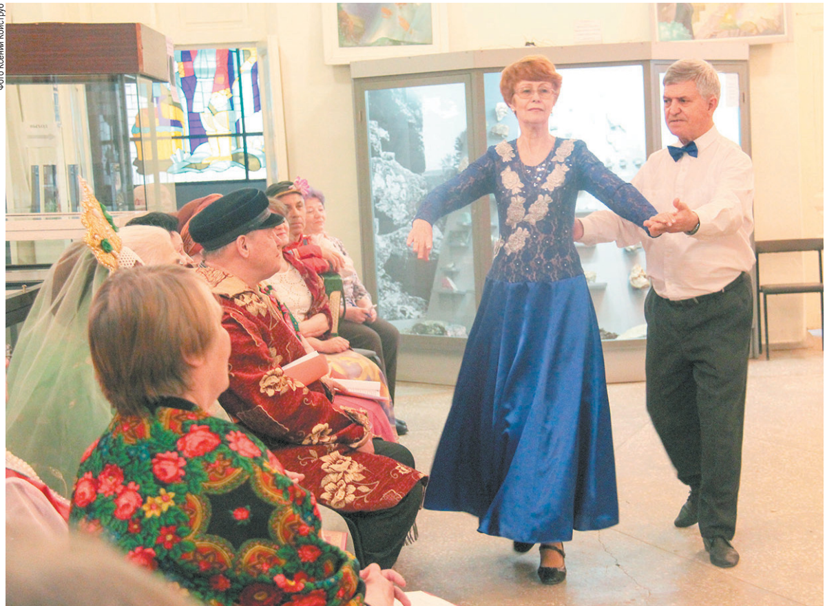
Перед ветеранскими организациями выступил ансамбль бального танца «Реверанс»

Совет ветеранов Полевского криолитового завода провёл экскурс в историю южной части города. Назвавшись «Еланские девчата», ветераны-криолитчики напомнили, что именно с трёх улиц с этим названием начинался Полевской, жизнь которому дал Гумёшевский рудник. С XVIII века данное месторождение медных руд также приобрело всемирную известность как основной поставщик малахита. Много ветеранами было