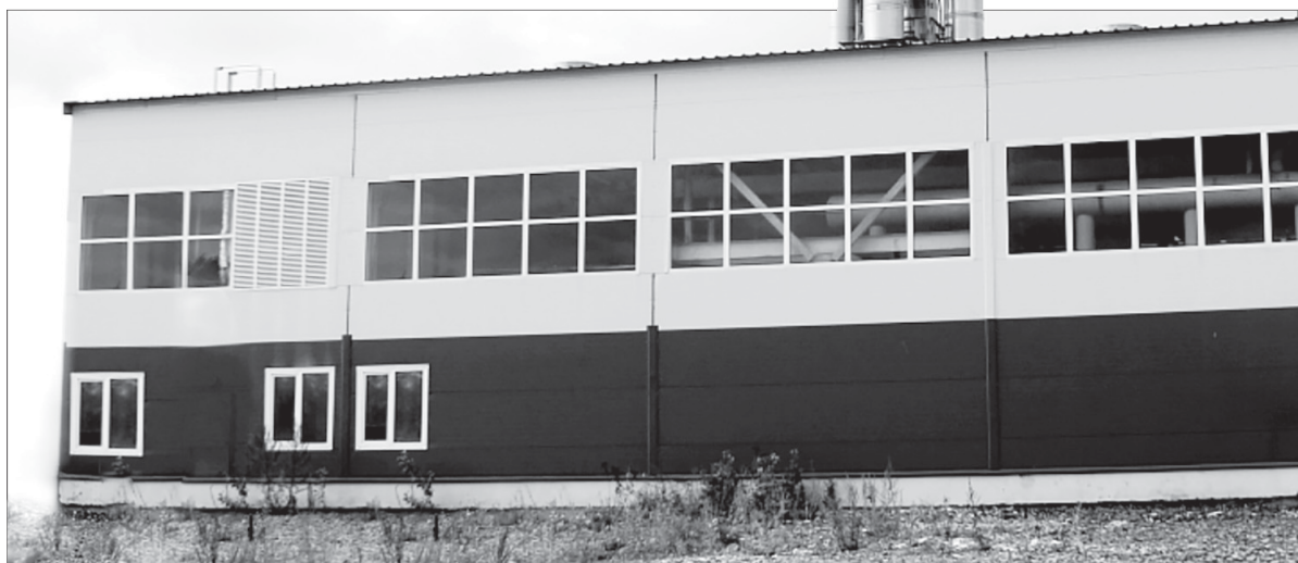
С января 2018 года «Новая энергетика» стала единой теплоснабжающей организацией в южной части Полевского и подписала прямые договоры с потребителями – физическими и юридическими лицами

Как пояснили в Минстрое РФ, при переходе на прямые платежи между собственником и ресурсо- снабжающей организацией будет действовать типовая договор, регламентирующий стандарт- ные условия предоставления услуги. Порядок его заключения будет носить уведомительный характер и со стороны потреби- телей не потребует ни дополни- тельных подписаний, ни обраще- ний к компаниям-поставщикам. Размер платы за жилищно-коммунальные услуги останет- ся неизменным. Разница будет лишь в том, что платежи будут направляться непосредственно их поставщикам: за коммуналь- ные услуги – ресурсоснабжаю- щим организациям, за жилищ- ные – управляющим компаниям.