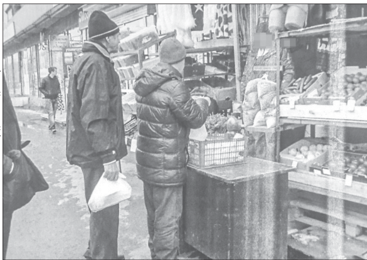
На Карла Маркса, 21, регулярно идёт нелегальная уличная торговля

Три протокола об административных правонарушениях по статье «Торговля в не отведённых для этого местах», результат рейда, рассмотрены на заседании административной комиссии, которое состоялось 17 апреля. Оштрафованы трое иностранных граждан. Одна женщина торговала искусственными цветами, ей назначили минимальный штраф 3000 рублей, по той причине, что к ответственности привлекается первый раз, в отличие от двух её коллег. Второй женщине назначили штраф 5000 рублей: к ответственности она привлекается в пятый раз. Она продавала швейные изделия; комиссии