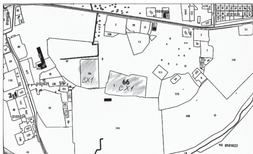
Площади в районе Косого Брода, используемые АО «Уральский» для выращивания свиней и складирования отходов их жизнедеятельности

Отметим, что администрация Полевского и руководство АО «Уральский» разработали специальный план мероприятий, выполнение которых, по мнению обеих сторон, поможет устранить одну из главных проблем, мешающих жителям, – неприятный запах от свиных отходов.