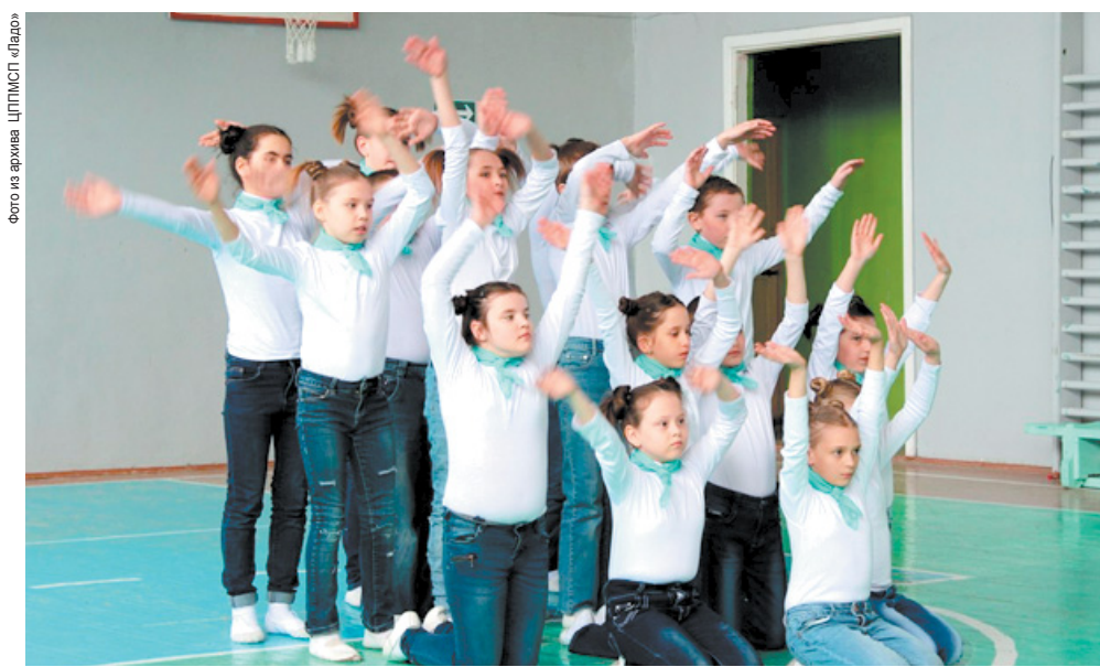
Городской фестиваль современного танца «Живи танцюя» прошёл в школе №8 13 апреля. В нём приняли участие 20 детских коллективов

Можно только догадываться, каких усилий стоит подготовка к ежегодному фестивалю, тем более что большинство номеров создаются без помощи взрослых. Сколько компетенций отработывается в процессе – от навыков успешной коммуникации до воплощения и представления на суд