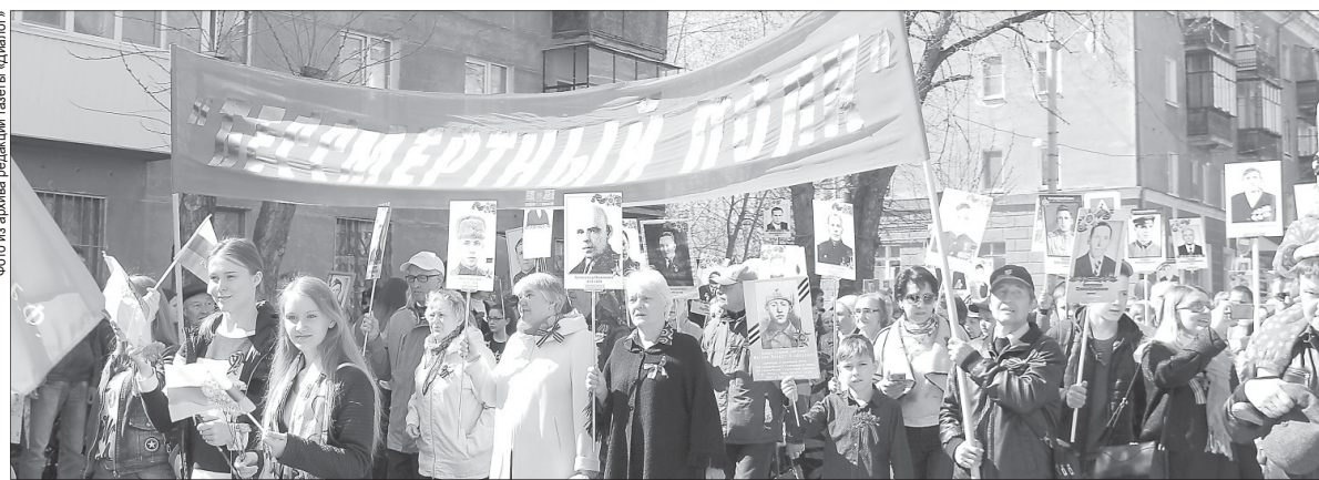
В прошлом году в акции «Бессмертный полк» приняли участие более 400 полевчан

Заседание оргкомитета по подготовке к проведению майских праздников состоялось 12 апреля в администрации Полевского городского округа. Праздник Весны и Труда в нашем городе по традиции начнётся с шествия: колонна начнёт формироваться у заводоуправления Северско-