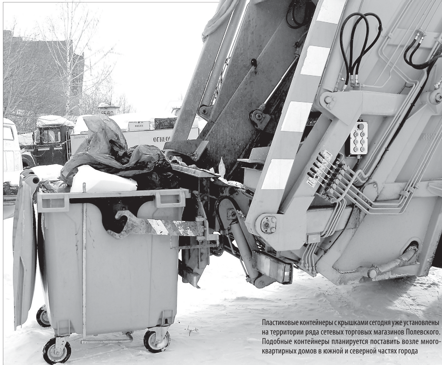
Пластиковые контейнеры с крышками сегодня уже установлены на территории ряда сетевых торговых магазинов Полевского. Подобные контейнеры планируется поставить возле многоквартирных домов в южной и северной частях города

Что изменится в Полевском со вступлением в силу новой территориальной схемы обращения с твёрдыми коммунальными отходами, обсудили в редакции «Диалога» за круглым столом