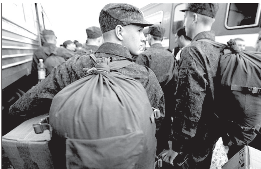
В ходе осенней призывной кампании прошлого года в Свердловской области на военную службу призваны 3959 уральцев

В Полевском городском округе призывная кампания началась 2 апреля. Утверждены планы призыва и порядок работы призывной комиссии в весенний период, подготовлены все необходимые документы. За период весенней призывной кампании в ряды Российской армии планируется призвать 92 человека (в прошлом году на службу ушли 108 призывников). Большинство из них будут служить в Центральном военном округе в сухопутных войсках. В связи с проведением в России Чемпионата по футболу многих ребят призовут служить в рядах Росгвардии в целях обеспечения безопасности.