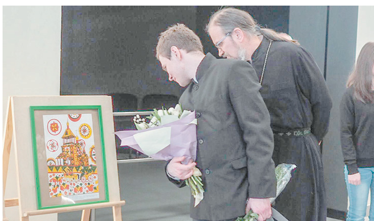
Выставка, посвящённая 300-летию Полевского, проходит в центре Екатеринбурга

Почётными гостями на этот раз стали председатель Общественного объединения «Курултай башкир» Свердловской области, руководитель рабочей группы по работе с муни-