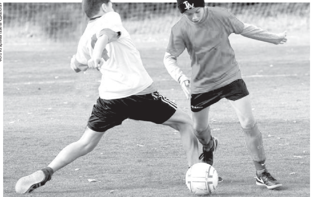
В 2018 году фестиваль «Метрошка» в Полевском пройдёт в июне. Год назад победители турнира – полевские команды «Дружба» и «Эверест» сыграли за Суперкубок и достойно представили Свердловскую область

Так, в прошлом году обладатели суперкубка в качестве приза от генерального партнёра фестиваля, Русской медной компании, получили возможность тренироваться и играть в Академии футбольного клуба «Зенит»! В этом году организаторы фестиваля – Фонд содействия развитию детского спорта «Метрошка» при поддержке губер-