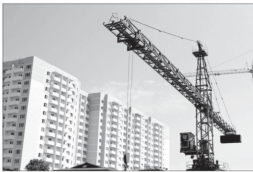
Западный управленческий округ занимает первое место по жилищному строительству

Анализ данных по управленческим окру- гам показывает, что первое место по жилищ- ному строительству занимает Западный управленческий округ – 105 тысяч квадрат- ных метров за первый квартал. За ним идёт Южный управленческий округ с показателем 60,2 тысячи квадратных метров. На третьем