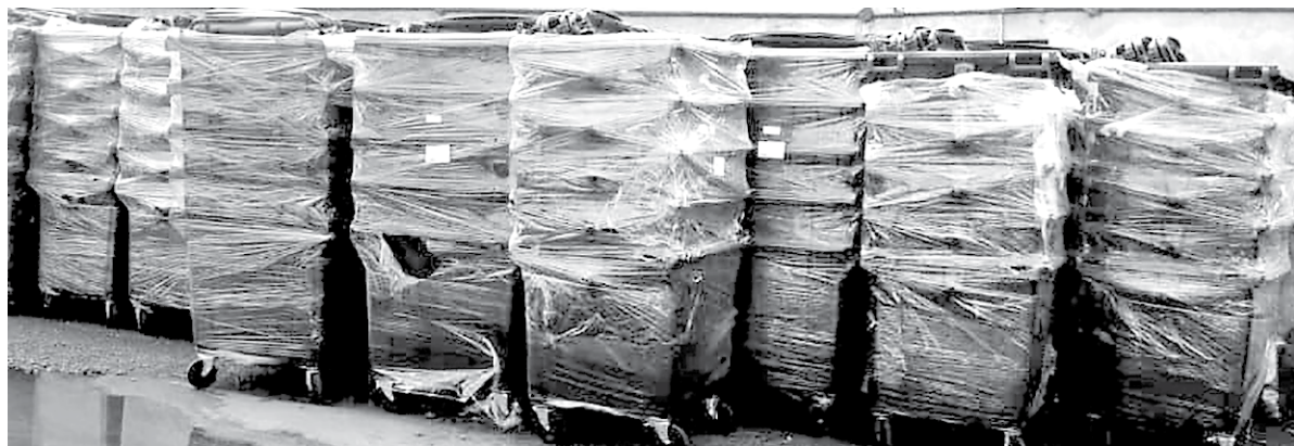
Контейнеры для Полевского закуплены и готовы к эксплуатации, утверждает региональный оператор

По его словам, в числе приоритетных задач сегодня – приведение объектов размещения ТКО в соответствие с требованиями законодательства, максимальное вовлечение жителей региона в централизованную систему сбора отходов. Также необходи-