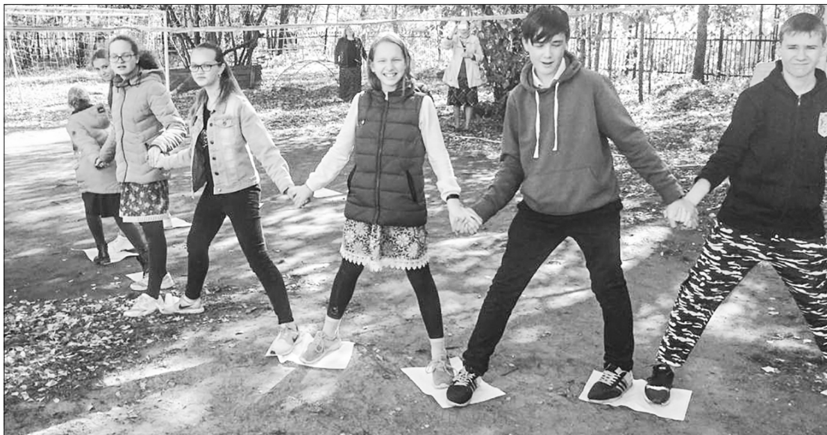
Занятия в воскресной школе Петра и Павла стартуют с тренингов на сплочение

В школе преподают 14 учителей. Каждую субботу и воскресенье они знакомят ребят с Законом Божиим, Священной историей Нового и Ветхого Завета, церковным пением и церковным искусством. Также дети изучают церковнославянский язык, особенности богослу-