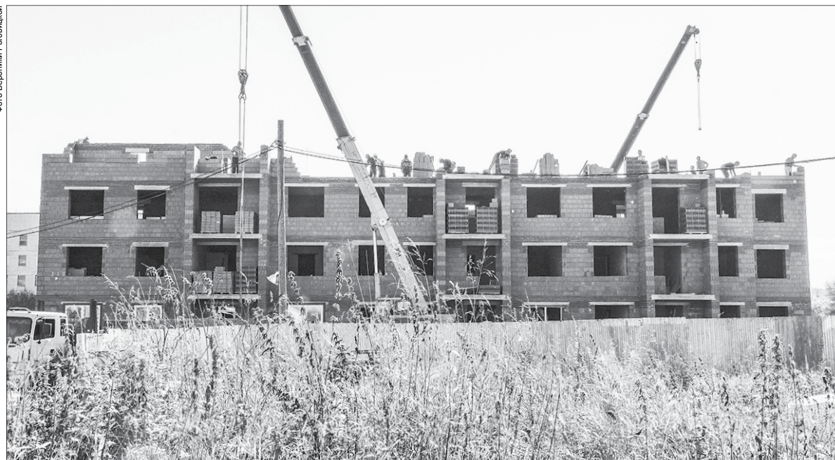
Пятиэтажный дом строится на улице Розы Люксембург в районе дома №112. Сегодня там возводят стены третьего этажа. Строительство планируют закончить к концу года

По управленческим округам первое место по объёмам жилищного строительства сохраняет за собой Западный управленческий округ – почти 193 тысячи квадратных метров за восемь месяцев года. За ним идёт Южный управленческий округ с показателем 138 тысяч квадратных метров. На третьем месте Горнозаводской управленческий округ – 81,3 тысячи «квадратов». Далее следуют Восточный управленческий округ – 52,8 тысячи и Северный управленческий