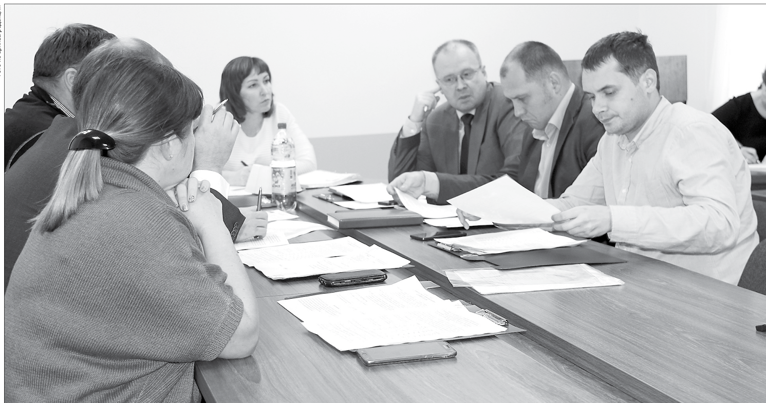
Как организовать в детских садах группы для годовалых малышей, обсудили народные избранники

Депутаты обсудили вопросы дошкольного образования и подвели итоги летней оздоровительной кампании 2018 года