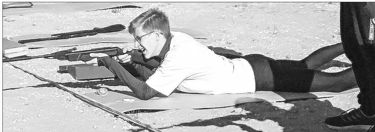
Каждому участнику бегатлона нужно поразить три мишени пятью выстрелами

На стадионе школы № 16 прошли городские соревнования по бегатлону