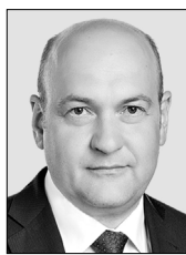
Глава Полевского городского округа Константин ПОСПЕЛОВ

Дошкольный возраст – это особенно важный период в жизни каждого человека, когда формируется личность и закладываются основы здоровья. Благополучное детство и дальнейшая судьба каждого ребёнка зависит от мудрости воспитателя, его терпения, внимания к внутреннему миру ребёнка.