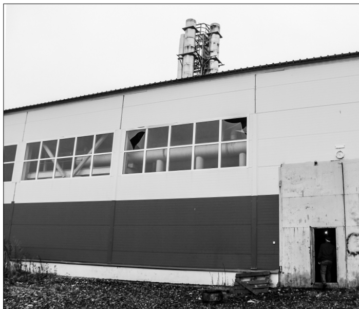
Котельную на 60 мегаватт приобретёт в собственность муниципалитет

– Промыли сети качественно, что, надеюсь, поможет провести отопительный сезон на хорошем уровне, – отметил глава. – Началась опрессовка. Если всё пройдет хорошо, в ближайшие дни запустим