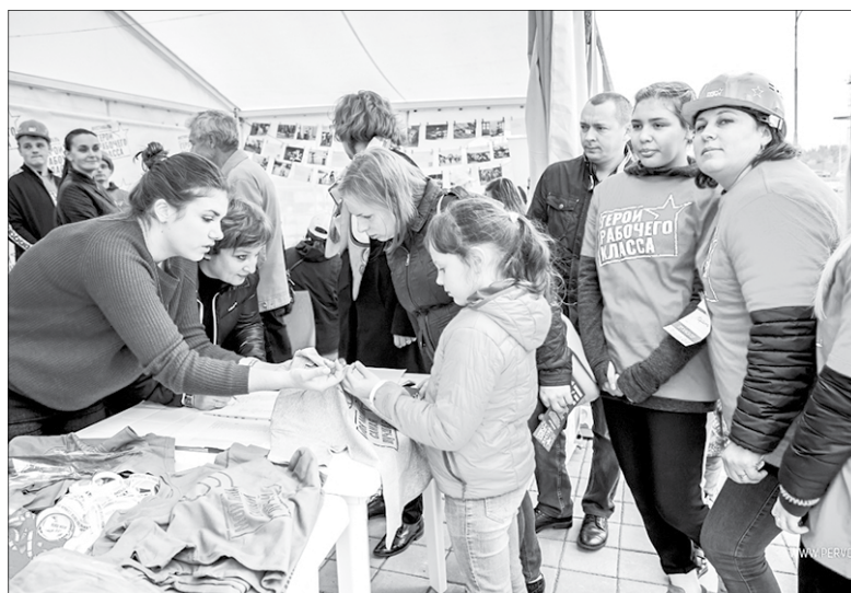
Из Полевского в фестивале приняли участие 12 человек

Кузницей кадров назвал Первоуральск председатель Союза ком-