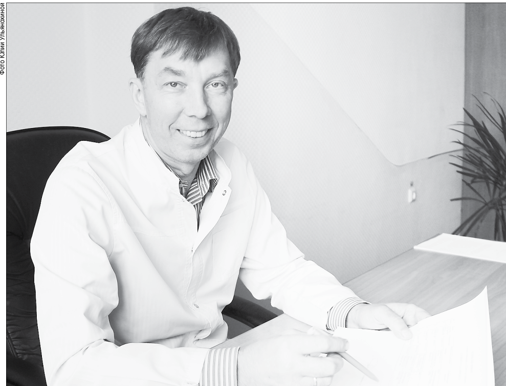
«Если мы не организуем работу кабинета неотложной помощи, то проект теряет смысл»

– Самая главная проблема, как и в большинстве малых городов, – это нехватка кадров. Пока не можем укомплекто-