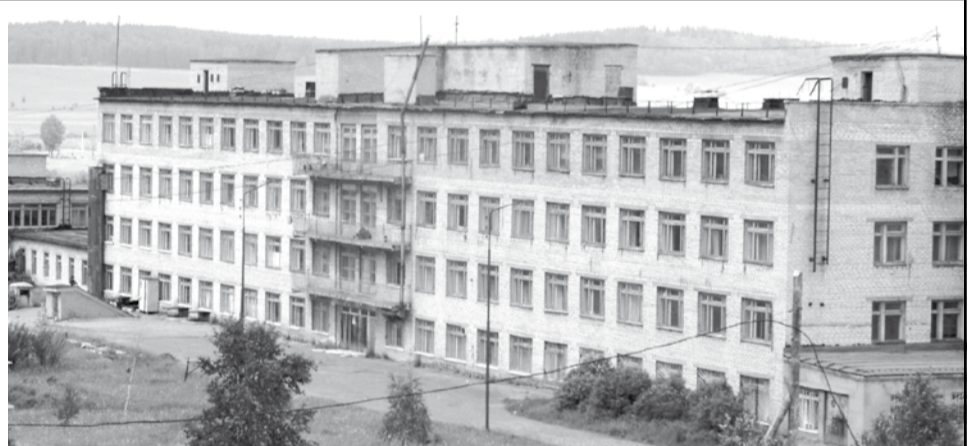
больнице – бардак.