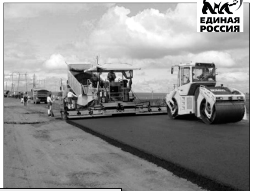
В 2011 году запланирован ремонт 44,781 км автодорог на сумму 257,4 млн.руб., капитальный ремонт 52,162 км на сумму 1031,3 млн.руб.

Порадовать свердловских автомобилистов могут не только новые дороги, но и резко сниженный транспортный налог. 17 мая 2011 года в областной Думе по инициативе фракции «Единая