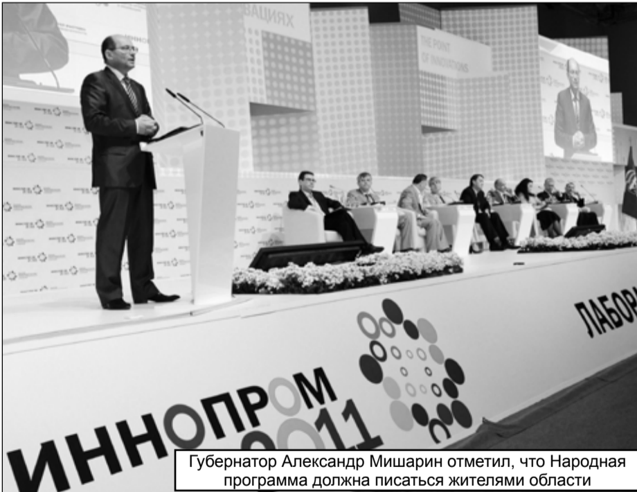
Губернатор Александр Мишарин отметил, что Народная программа должна писаться жителями области

Секция «Агропромышленный комплекс» обсуждала много проектов. Развитие свиноводства и обеспече-