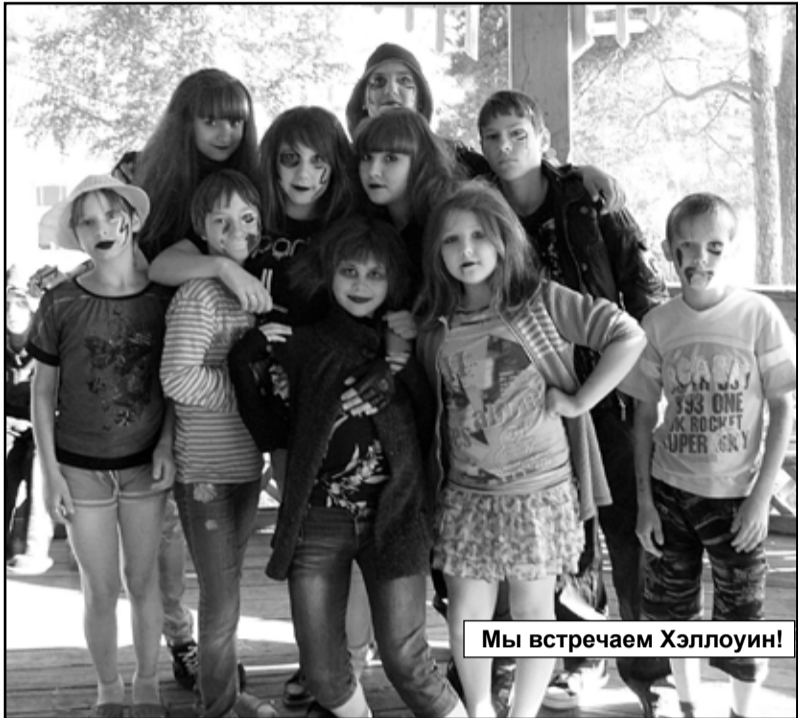
Мы встречаем Хэллоуин!

В начале июня на страницах газеты было опубликовано письмо, где жители города возмущались организацией детского летнего отдыха. Особые опасения у родителей вызывал незнакомый загородный лагерь «Актая», расположенный за Верхотурьем, где в этом году впервые было предложено отдохнуть нашим детям.