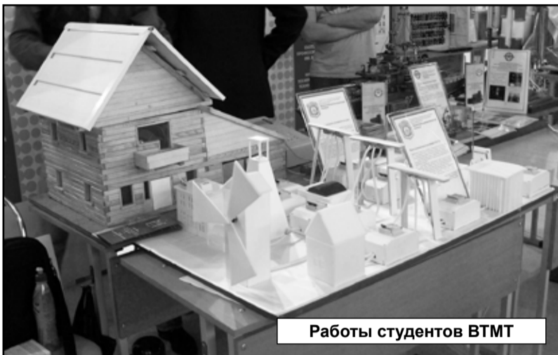
Работы студентов ВТМТ

жилищно-коммунального хозяйства», «Подготовка кадров для индустрии гостеприимства и сферы услуг», «Подготовка кадров для сферы транспорта», «Подготовка кадров для сельского и лесного хозяйства», «Подготовка кадров в сфере социально-культурных коммуникаций».