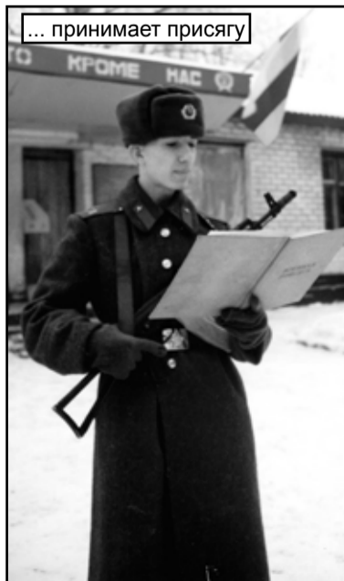
... принимает присягу