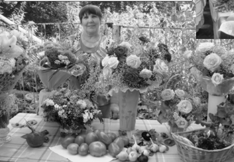
Экспонаты Р.В. Воскрещовой выше всяких похвал

ство прекрасного и склонность к инновациям проявили педагоги Детской школы искусств им. А.А.