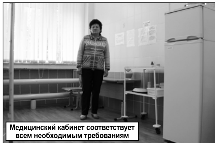
Медицинский кабинет соответствует всем необходимым требованиям