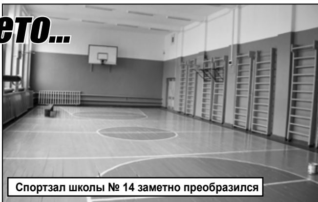
Спортивный зал школы № 14 заметно преобразился

Кроме того в школе №14 проведен капитальный ремонт помещения, в котором планируется разместить пол-