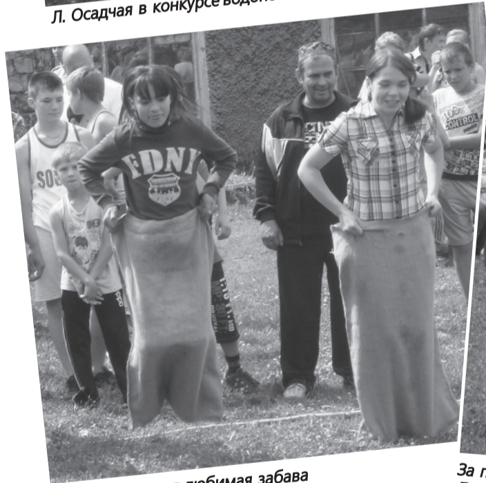
Бег в мешках - любимая забава