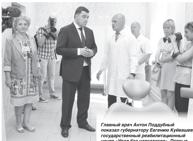
Главный врач Антон Поддубный показал губернатору Евгению Куйвашеву государственный реабилитационный центр «Урал без наркотиков». Первые пациенты – порядка 15 человек – начнут здесь лечение уже в июле.

«Чума XXI века» идёт семимильными шагами. Сегодня под наблюдением наркологов находятся около 10 тыс. уральцев.