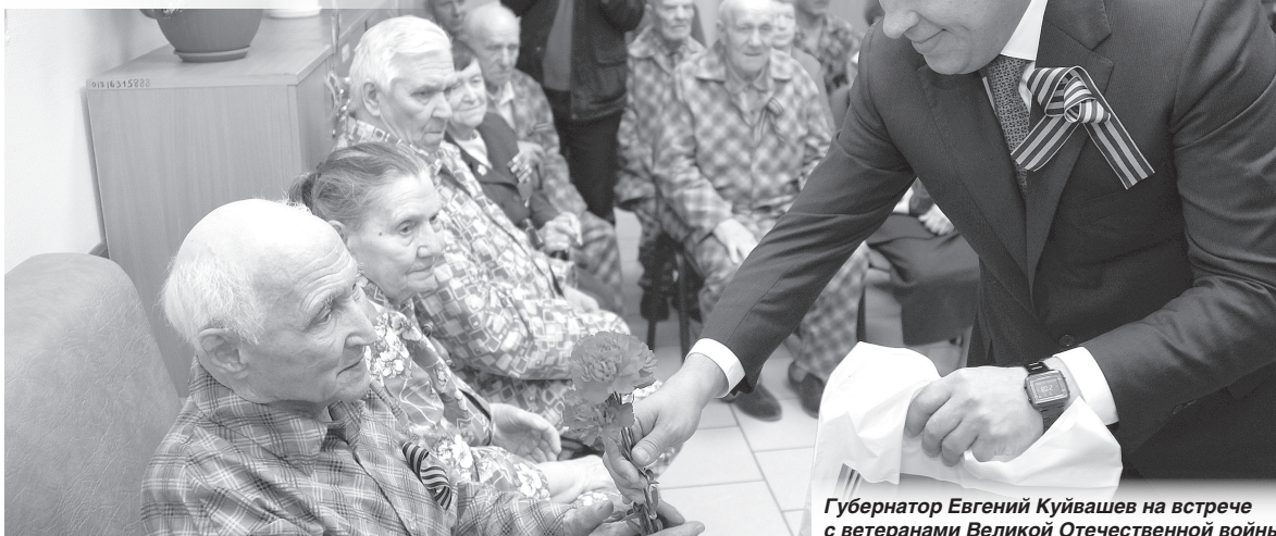
Губернатор Евгений Куйвашев на встрече с ветеранами Великой Отечественной войны

Губернатор Евгений Куйвашев подписал 29 июля указ о проведении Дня пенсионера в Свердловской области.