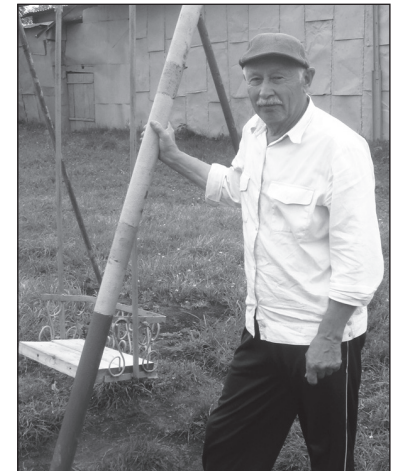
Н. Носарев: «Сами с руками...»

Надеемся, хороший пример жителей ул. Красноармейской будет заразителен, и новое поколение верхнетуриновцев тоже будет