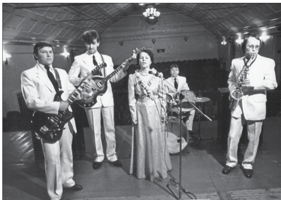
Вокально-инструментальный ансамбль «Созвездие»