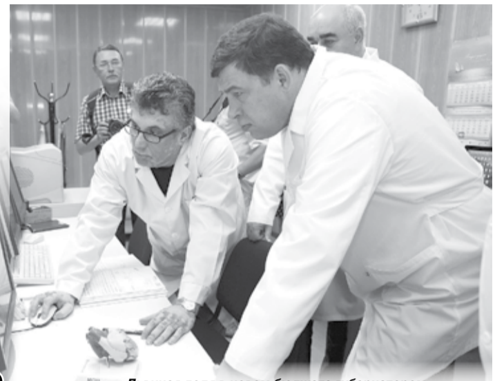
Львиная доля в новом бюджете губернатором Евгением Куйвашевым отводится проблемам медицины и увеличения продолжительности жизни уральцев.

Основные подходы при подготовке и принятии бюджета Свердловской области – безусловное выполнение социальных обязательств перед жителями региона, майских Указов Президента страны и разумная экономия бюджетных средств.