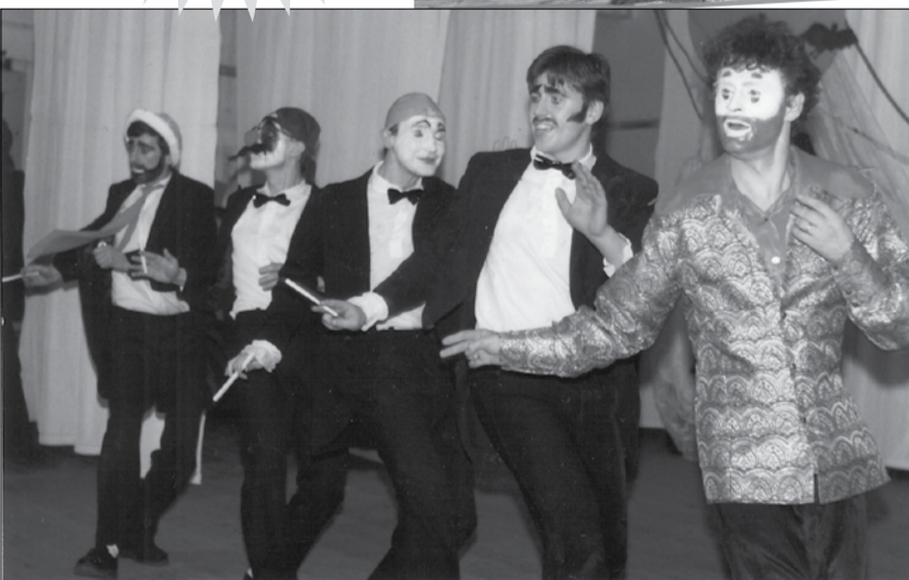
Маски-шоу от верхнетуринских театралов

Глава Городского округа Верхняя Тура А.В.Брезгин Председатель Думы ГО Верхняя Тура В.И.Золотухин