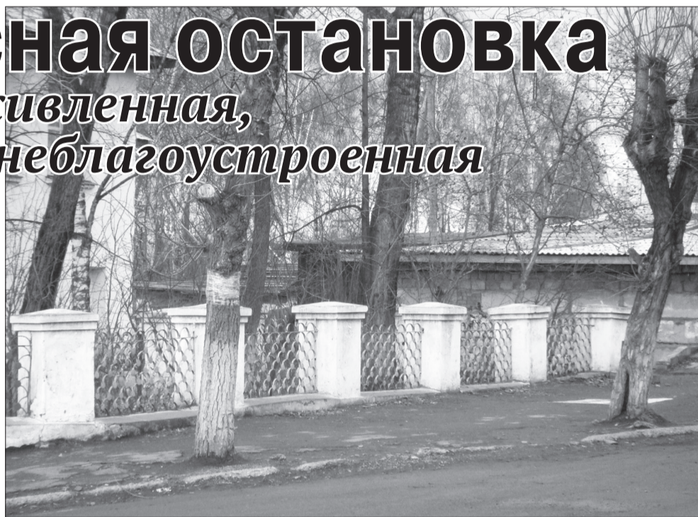
Трудно догадаться, что это остановка

Справедливости ради стоит отметить, что большинство остановок общественного транспорта в нашем городе оборудованы самым необходимым для более или менее комфортного ожидания маршрутки или автобуса. Казалось бы, вполне логично одной из первых оборудовать остановку