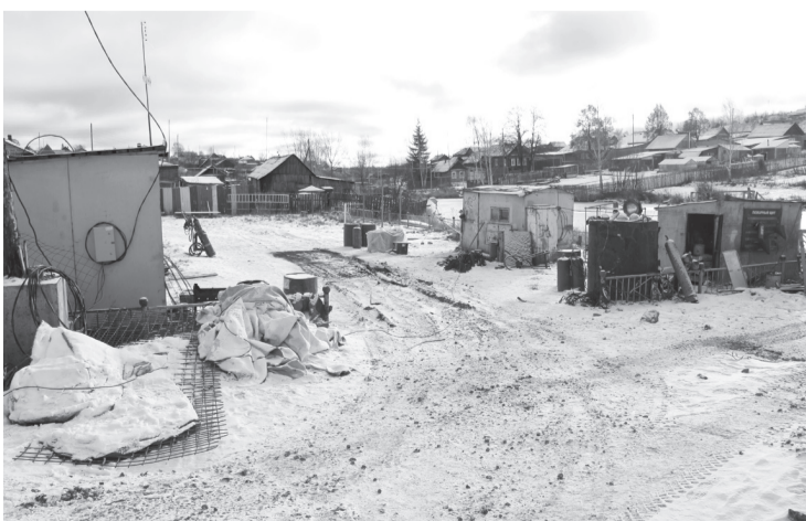
Детская площадка... Ее обещают восстановить весной 2014 г.