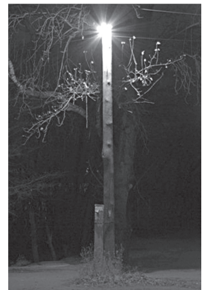
Здесь горит хоть один фонарь