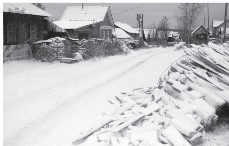
Налетев в темноте на эти доски и дрова, можно сломать руки - ноги

Мы воспользовались этим приглашением и совершили пешую экскурсию по улице Фомина. Что сказать? Улица такая же, как десятки других улиц частного сектора в нашем городе – не лучше