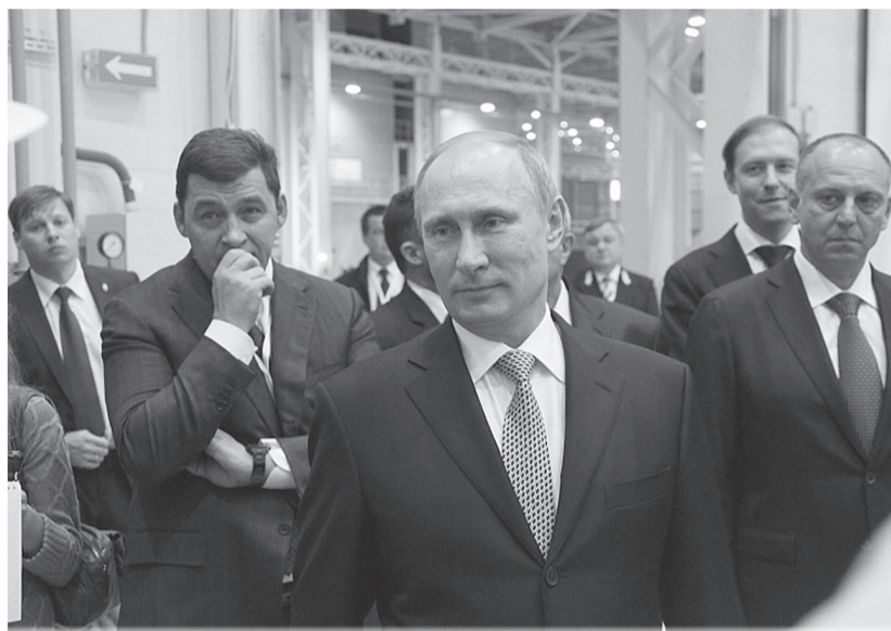
Президент Владимир Путин в сопровождении губернатора Евгения Куйвашева в завершение визита в Свердловскую область 11 ноября посетил завод «Уральские локомотивы» в Верхней Пышме, где в этот день был дан старт производству скоростных электропоездов «Ласточка».

Накануне финального марафона за право проведения «ЭКСПО 2020», на которое также претендуют Дубай (ОАЭ), Измир (Турция) и Сан-Паулу (Бразилия), главы двух государств Владимир Путин и Нурсултан Назарбаев дали высокую оценку Екатеринбургу в ходе X Межрегионального форума сотрудничества России и Казахстана.