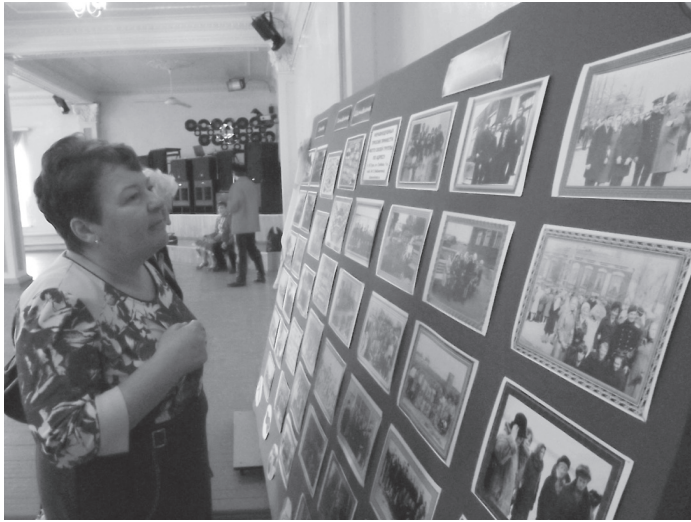
На стендах с фотографиями все гости торжественного вечера искали знакомые лица

На время вернуться в молодость, сесть за парту и увидеть любимых учителей... Об этом мечтает почти каждый взрослый. Такую возможность жителям города в эти выходные подарил Верхнетуриинский механический техникум. В честь 70-летнего юбилея, который учебное учреждение отмечает в этом году, прошел торжественный вечер, который больше напоминал расширенный вечер встречи выпускников.