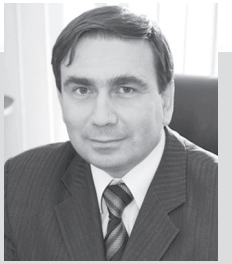
Николай Смирнов, министр энергетики и ЖКХ:

- Опубликованная региональная программа ремонта многоквартирных домов вынесена на обсуждение жителей области и пока носит статус проекта. После того, как в программу будут внесены поправки, сформированные в процессе обсуждения, она будет утверждена постановлением Правительства Свердловской области, и приобретет силу обязательного к исполнению документа.