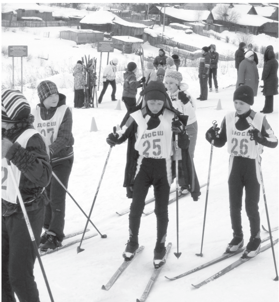
До старта остались считанные минуты

15 марта на лыжной трассе школы № 19 прошли соревнования по лыжным гонкам, посвященные памяти героя Советского Союза В.И. Бадьина.