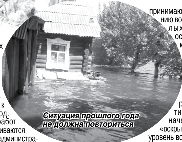
Ситуация прошлого года не должна повториться

Кроме того, работники жилищно-коммунальных предприятий города пред-