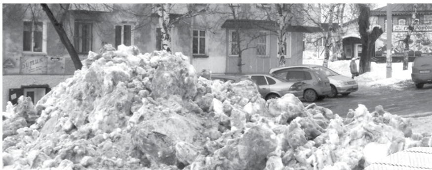
Снега в этом году выпало больше, чем обычно

Администрация города принимает необходимые меры для безаварийного пропуска паводковых вод. Для предотвращения возникновения чрезвычайных ситуаций и обеспечения защиты населения все службы, имеющие отношение к эксплуатации гидротехнических объектов, заранее начали подготовку к паводку.