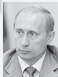
Президент РФ Владимир Путин:

«На мой взгляд, нужно обязательно совместить профессиональные стандарты с образовательными стандартами. Нужно добиться того, чтобы были ориентиры для профессионального образования во всех его уровнях и ипостасях, чтобы приходящий на работу молодой человек сразу чувствовал себя уверенно на своём месте».