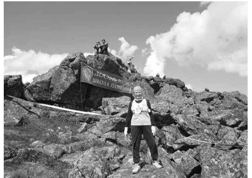
Вот она, вершина Конжака

- Каждое путешествие приносит новые ощущения. Кажется, тропа одна и та же, а впечатления другие.