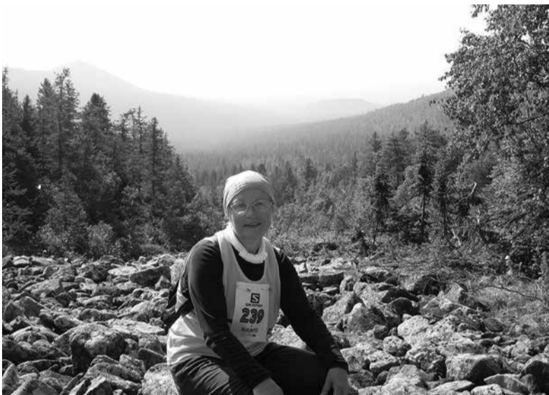
Идти по такому скальнику не просто

Ирина ЛУБЕНЕЦ