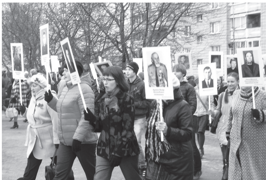
Идут участники всероссийской акции «Бессмертный полк»