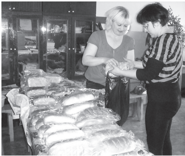
Специалисты соцслужбы формируют продуктовые наборы

приняли активное участие в сборе вещей, мебели, предметов домашнего обихода, бывших в употреблении, в которых нуждаются, в первую очередь, многодетные и малообеспеченные семьи.