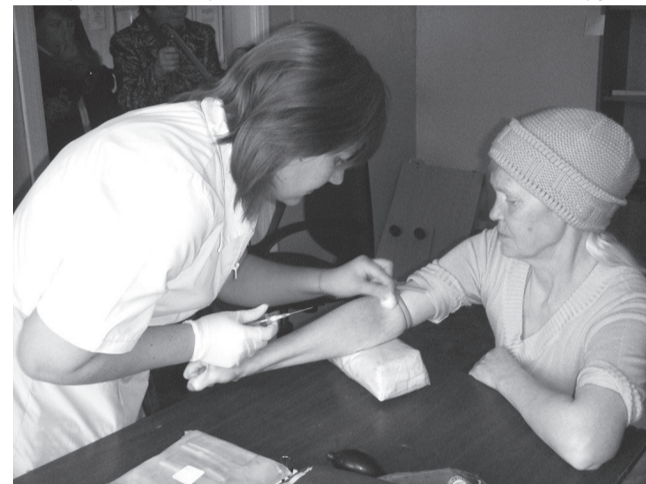
Все желающие могли сдать кровь на анализ