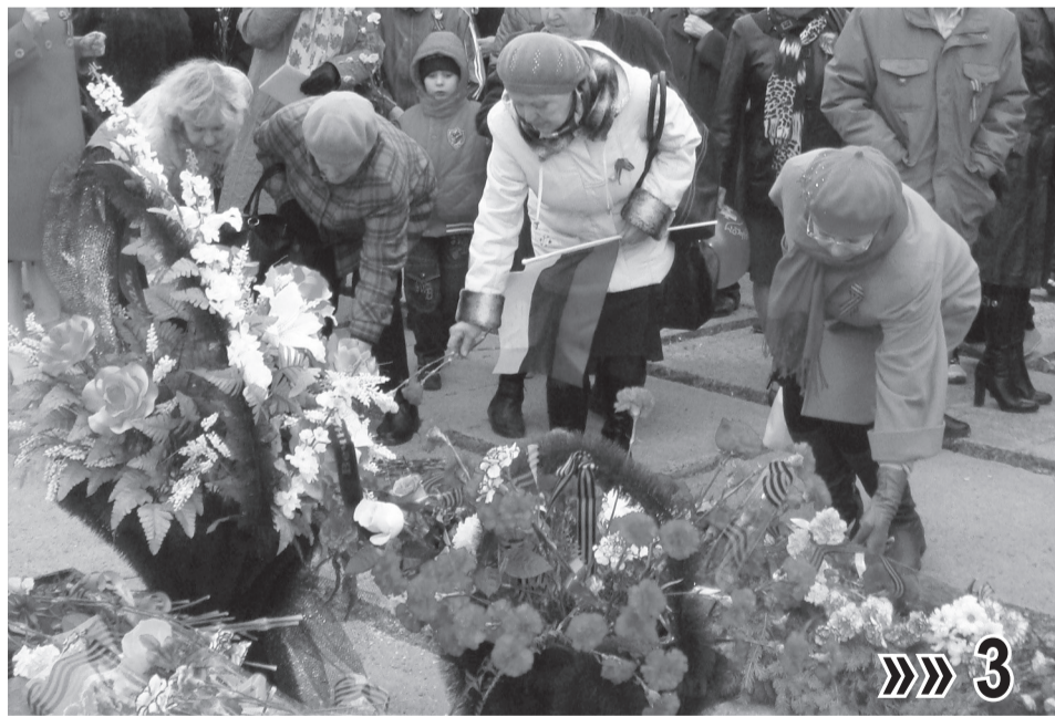
Верхнетуринцы возложили цветы к Мемориалу Славы

В этом году 9 Мая в Верхней Туре прошло не совсем обычно. Перед торжественным митингом всех горожан пригласили на городскую площадь, где состоялась праздничная программа с участием творческих коллективов города.