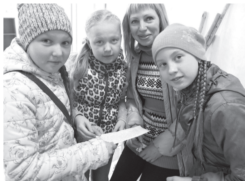
Команда «Стрела»: «Стартовое задание выполнено!»

все участники игры получили призы и подарки. Но, наверное, лучшей наградой стали азарт, хорошее настроение и новые знания об истории города, которые подарила игра.