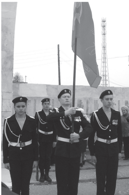
В почетном карауле - курсанты ВПК «Мужество»

В этом году 9 Мая в Верхней Туре прошло не совсем обычно. Перед торжественным митингом всех горожан пригласили на городскую площадь, где состоялась праздничная программа с участием творческих коллективов города.