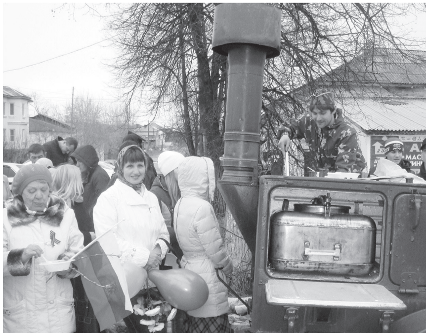
Какой День Победы без полевой кухни!