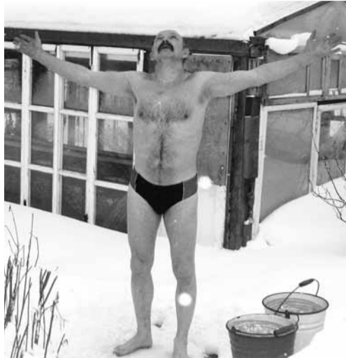
Перед тем как облиться, нужно попросить здоровья себе и другим

версальное средство здоровья и долголетия. И как показатель этого - излечение от многих серьезных заболеваний, в том числе ра-