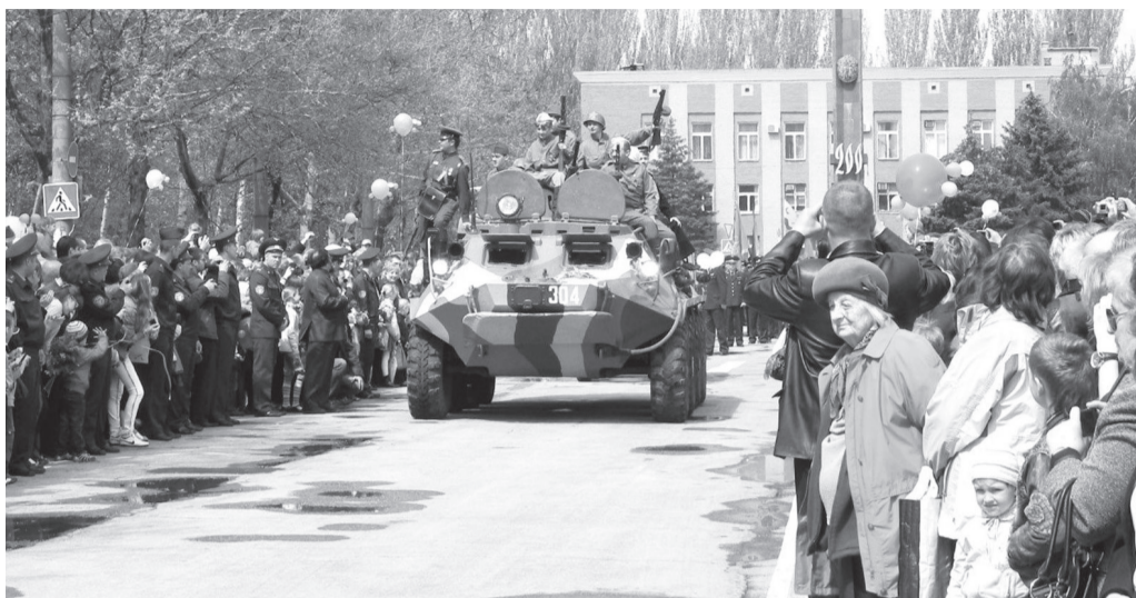
Танки в Мелитополе были, но в честь Парада Победы