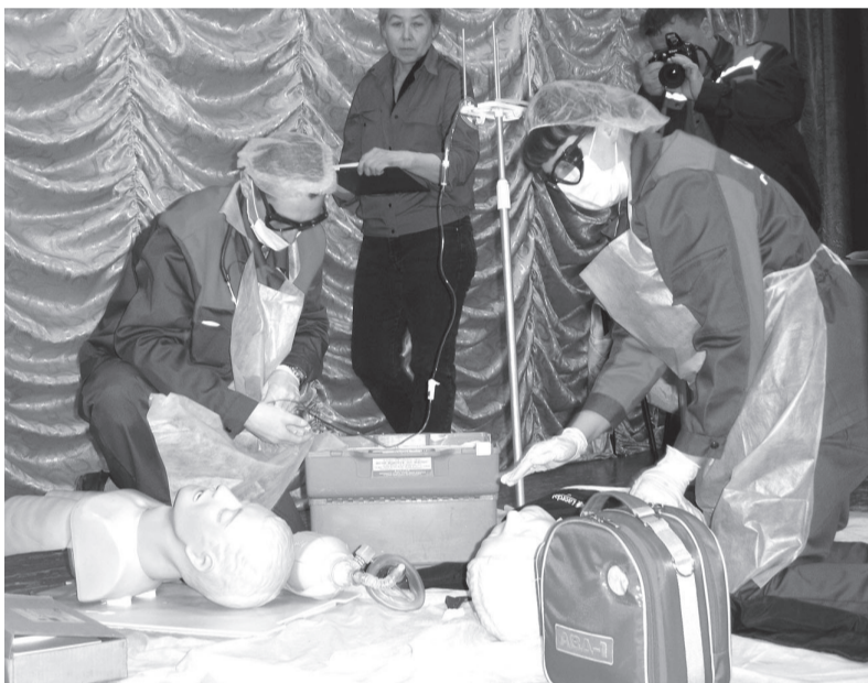
Тяжело в учении... Реанимационные мероприятия сначала до автоматизма отрабатываются на манекенах.

Людмила ШАКИНА Фото из архива отделения скорой помощи