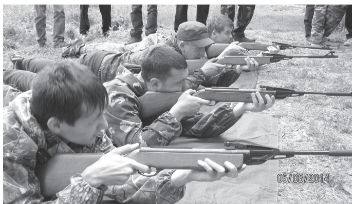
Кто из мальчишек не любит пострелять!