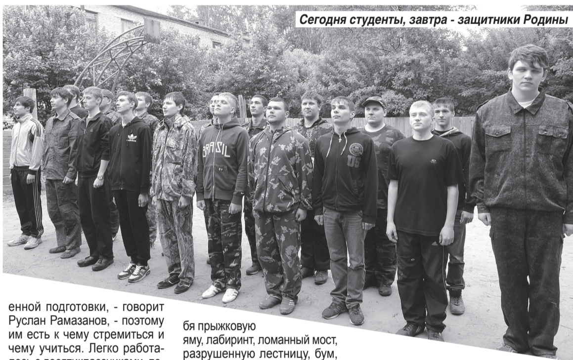
Сегодня студенты, завтра - защитники Родины

Идет весенний призыв, и новые ребята идут служить, выполняя долг перед Отечеством и перед собой. Бывшие мальчики становятся настоящими мужчинами и достойными защитниками своей Родины. А что значит для них Родина? Двор дома, старый тополь у ворот, школа, сверстники... Родина разная, но у всех она одна. Обостренное чувство любви к своему дому, Отечеству приходит к новобранцам именно в армии.