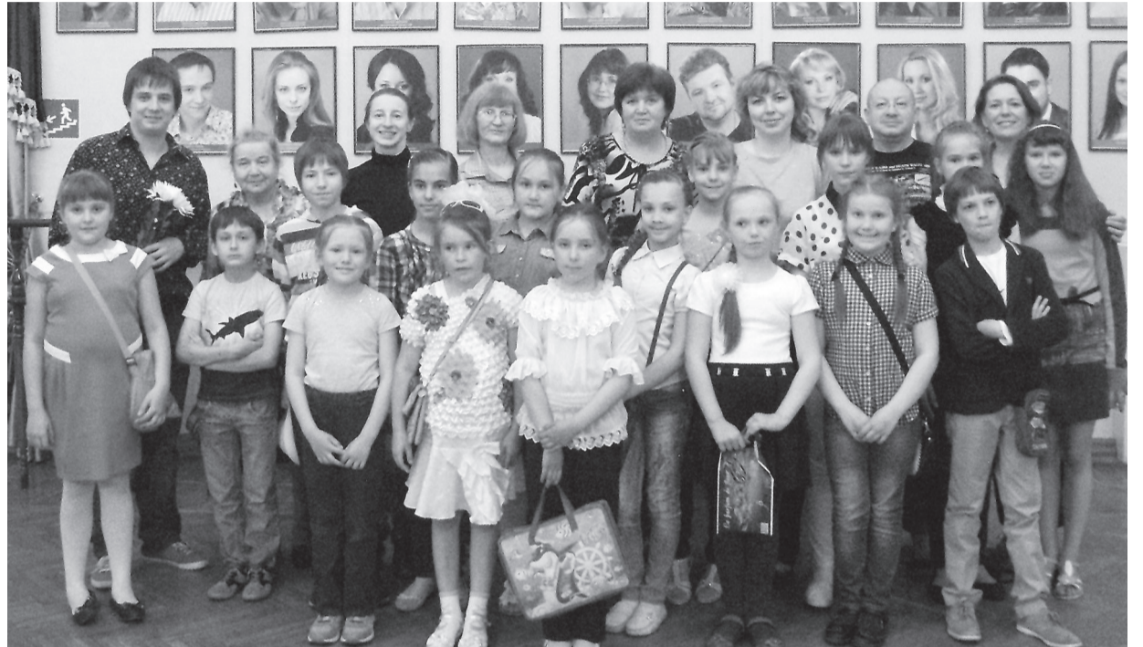
Музыкальный спектакль произвел на ребят неизгладимое впечатление

ся, что у этой крохотной, но очень смелой девочки была мечта – научиться летать. Вот об этом и был спектакль. Сбылась ли мечта Дюймовочки – зрители узнают только в конце. А вот мечта наших ребят точно