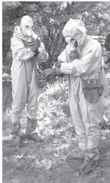
Надеть химзащиту - дело трех минут