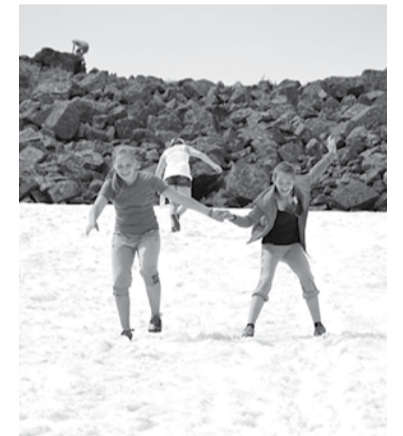
Дети были в вострге от снега