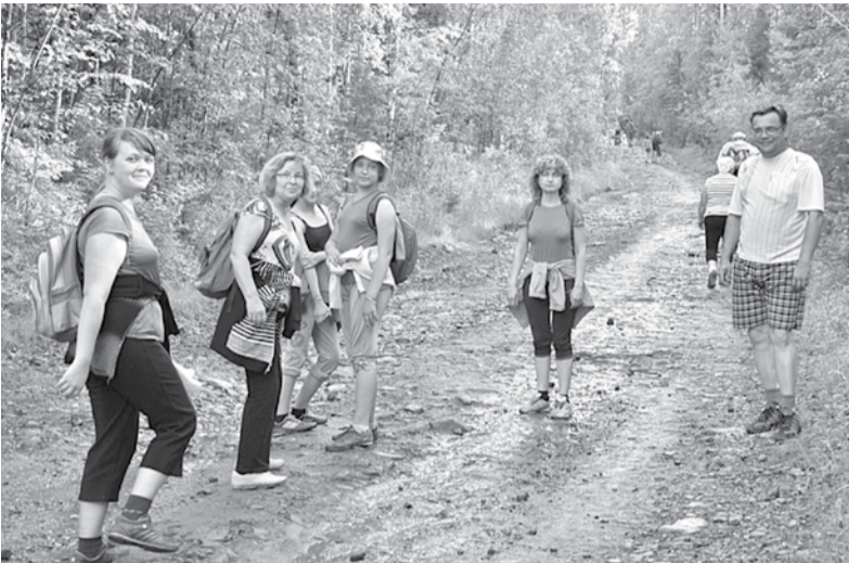
Вперед, за отрывными ощущениями

Древние уральские горы, возраст которых 500 миллионов лет. Высота более 1500 километров над уровнем моря. Непроходимая тайга, лесотундра, гористые массивы. Вот что представляет собой путь к самой высокой точке Свердловской области – к Конжаковскому камню. Каждый год этот путь пытаются преодолеть тысячи туристов со всей страны. Но удается это единицам.