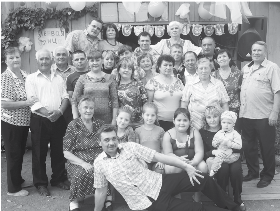
Жители улицы Первой дорожат своей дружбой и традициями