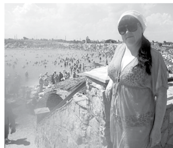
На Соль-Илецких озерах люди отдыхают и лечатся