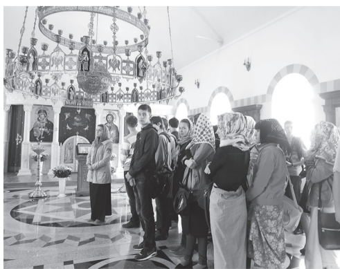
На экскурсии в храме