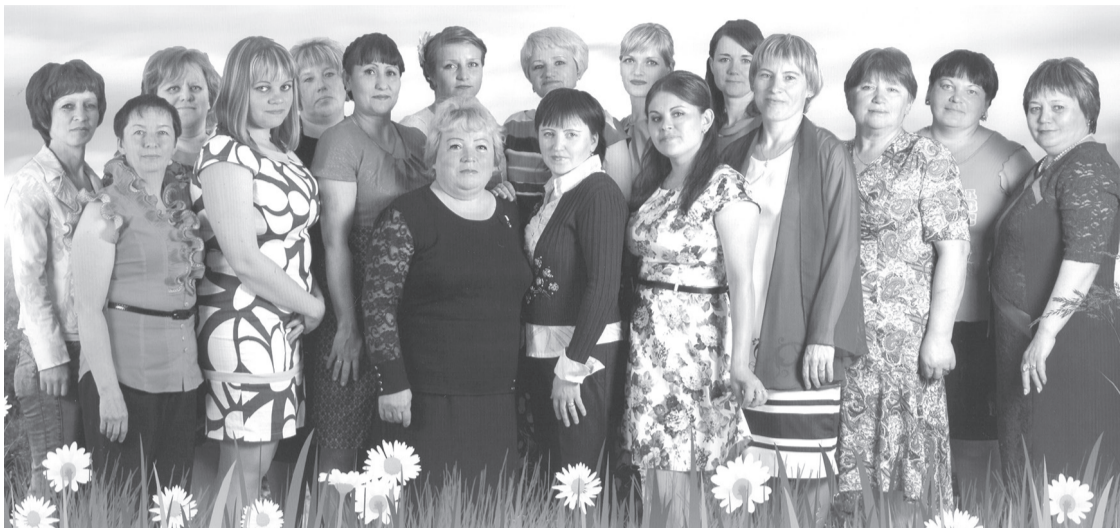
Коллектив детского сада № 56 сегодня. Благодарна и трудна работа ежедневно маму заменять...