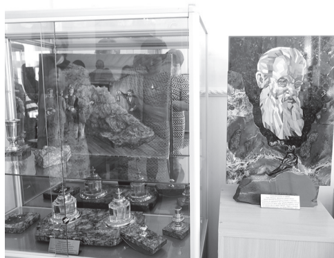
Портрет П. Бажова выполнен из уральских камней

Телефон: 8 (343)295-15-92 Электронная почта: cdo@m.ursmu.ru.