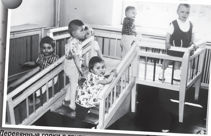
Деревянные горки в группах - еще один подарок строителей.

Уральский горный университет принимает поздравления со 100-летием