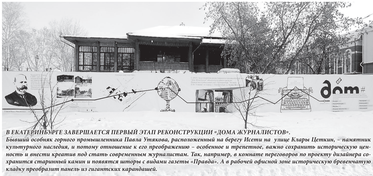
В ЕКАТЕРИНБУРГЕ ЗАВЕРШАЕТСЯ ПЕРВЫЙ ЭТАП РЕКОНСТРУКЦИИ «ДОМА ЖУРНАЛИСТОВ».

В столицу Среднего Урала съедутся вице-губернаторы, министры, руководители департаментов, курирующих взаимодействие с прессой, редакторы СМИ. Ожидается, что в работе совещания примут участие более трехсот участников из всех регионов РФ, в том числе из Крыма и Севастополя. Отметим, что это первое мероприятие такого масштаба под эгидой Министерства связи и массовых коммуникаций РФ с привлечением руководителей региональных СМИ.