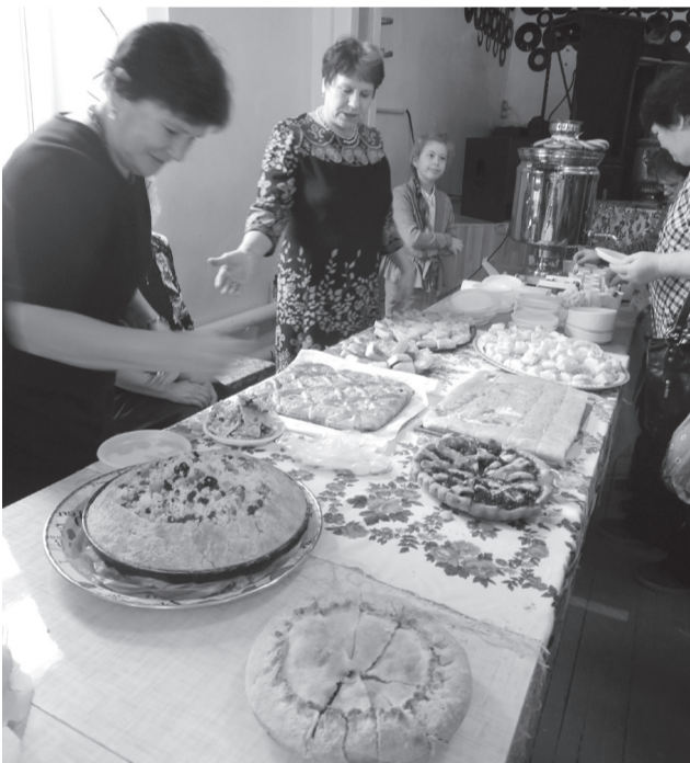
Какой праздник без угощения!