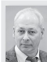
Алексей Волин, заместитель министра связи и массовых коммуникаций РФ

Замглавы Минкомсвязи Алексей Волин признал, что в настоящее время даже такие крупные издания, как «Российская газета», «не тянут» тарифы ФГУП «Почта России». В связи с этим, сообщил он, в настоящее время министерство прорабатывает вопрос альтернативного распространения печатных СМИ.