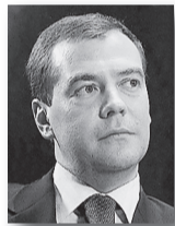
Дмитрий Медведев, председатель Правительства РФ: