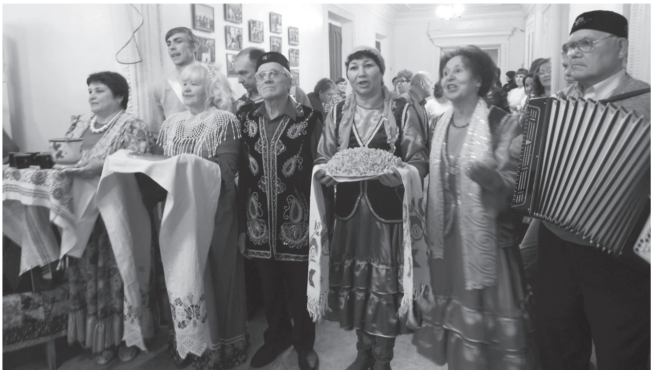
Гостей фестиваля встречали хлебом-солью и чак-чаком

На митинге в честь Дня народного единства, который прошел 4 ноября на площади Труда в г. Екатеринбурге губернатор Евгений КУЙВАШЕВ в своем выступлении сказал: «Для многонационального Урала идея единства нации – важна и актуальна. Мы очень крепкий, сильный регион в плане развития институтов гражданского общества: у нас свыше семи тысяч общественных организаций, мощное профсоюзное движение. В Свердловской области проживают представители 160 народов, действуют более 600 религиозных организаций. В нашей области никогда не было и, уверен, не будет национальных либо религиозных конфликтов. Это единство, сплоченность всегда были одной из главных составляющих успешного развития Свердловской области – Опорного края державы».