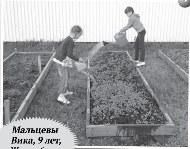
Мальцевы Вика, 9 лет, Женя, 6 лет

Шире ротик открывай, Побыстрей, братишка, вырастай, Вместе будем мы играть, Вместе маме помогать.